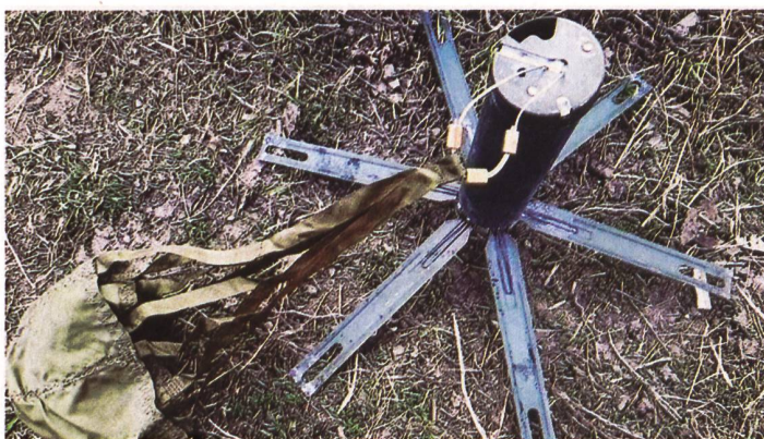
▲ Das Fernverminnungssystem ISDM wurde anlässlich der Manöver Zapad 2021 erstmals erkannt.