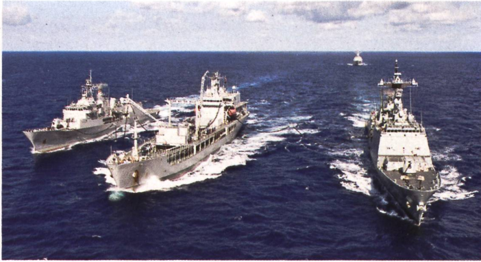
◀ Chinesische Schiffe auf der Fahrt nach Taiwan.