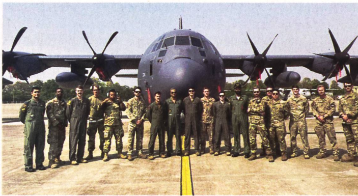
US-amerikanische und indische Luftwaffensoldaten.

le Instabilität und fragile Sicherheitslage verantwortlich zu machen. Es sei denn auch nicht die mangelnde Sicherheit, so Experten, an der Israel derzeit leide. Viel eher sei es der Ministerpräsident, der möglicherweise den Bezug zur Realität verloren habe. pk