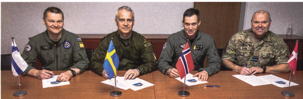
Die skandinavischen Luftwaffenchefs unterzeichnen das Zusammenarbeitsabkommen.

Norwegen ergänzt seine 37 F-35 mit zusätzlichen 15 Stück und Dänemark ersetzt seine 44 F-16 durch 27 F-35. Es wird erwartet, dass die zukünftige Integration der schwedischen Jets nicht ganz einfach werden dürfte. Gemäss den aktuellen Rüstungsplanungen in Stockholm ist nicht ersichtlich, dass das Königreich in absehbarer Zukunft von seinem Saab-Programm abweichen wird und auf das Joint-Strike-Fighter-Programm umschwenkt. Die Schweden versicherten jedoch, dass der Gripen E dereinst vollkommen mit den NATO-Systemen interoperabel sein wird. Entsprechend wurde zum Abschluss der Unterzeichnung der gemeinsamen Erklärung folgendes Statement abgegeben: «In Zukunft werden wir die transatlantischen Bindungen stärken, mit grosser Dynamik die laufenden Integrations- und Kooperationsprozesse fortsetzen, uns auf die Durchführung von Multi-Domain-Operationen vorbereiten und durchhaltefähige, langfristige Lösungen aufzeigen, um damit unsere gemeinsamen Ziele zu erreichen». pk