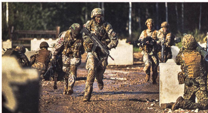
Lettisches Reservistentraining.

gesamt bis zu 50 000 Soldaten zurückgreifen zu können. Davon wären 14 000 aktive Streitkräfteangehörige (aktuell etwa 6700), 16 000 aus der Nationalgarde (aktuell rund 9500) und 20 000 Reservisten (aktuell zirka 3000). Die bevorstehende Verdoppelung der Streitkräfte will sich das Land einiges kosten lassen. Für die nächsten Jahre sollen 2,5 Prozent des BIP für Verteidigung ausgegeben werden. Bis anhin waren es etwa 760 Millionen Euro jährlich. Die Regierung muss aber zuerst noch beweisen, woher sie das Geld nimmt. Denn auch im Baltikum bleibt nebst der sicherheitspolitischen auch die wirtschaftliche Situation angespannt. Was letztendlich zum nächsten Problem führt: Viele Junge verlassen das Land, um im Ausland mehr Geld zu verdienen und Karriere zu machen. Mit etwas mehr als 1,8 Mio. Einwohnern und einer seit dem Jahr 2000 anhaltenden Schrumpfung der Bevölkerung von jährlich knapp über einem Prozent werden die demografischen Begebenheiten deshalb auch in Zukunft eine der grössten Herausforderungen bleiben. pk