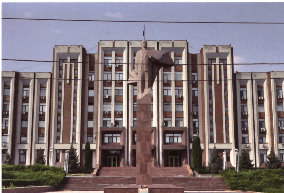
► Sowjetarchitektur vom Feinsten: Ein Regierungsgebäude samt Lenin-Denkmal in Transnistriens «Hauptstadt» Tiraspol.

Die UdSSR trieb die Industrialisierung der Städte entlang des Dnjestr voran. Dies