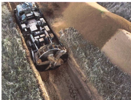
In der Nähe der Kleinstadt Hirske erstellen Wagner-Truppen einen mehrstufigen Verteidigungswall. Zum Bau der tiefen Gräben kommt auch eine Pioniermaschine vom Typ MDK-3 aus der Sowjet-Ära zum Einsatz.

Rein begrifflich, aber auch von der öffentlichen Berichterstattung her, lassen sich scheinbar einige Eindrücke mit den Gegebenheiten im Ersten Weltkrieg vergleichen. Mithilfe von Satellitenaufnahmen und ei-