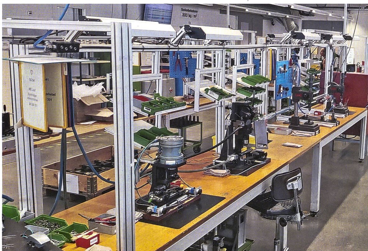
► Blick in den Montageraum für Sturmgewehre.

Alle unsere Produkte haben einen klar definierten Einsatzbereich, entweder im zivilen, behördlichen oder militärischen Be-