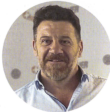
Pasquale Caputi, CEO SIG Sauer AG

Wir haben eine schweizerische und eine amerikanische Linie. Die Schweizer Linie konzentriert sich auf das traditionelle Sturmgewehr 90 in verschiedenen Ausführungen und auf Granatwerfer. Diese entwickeln wir ständig weiter. Unsere Produkte