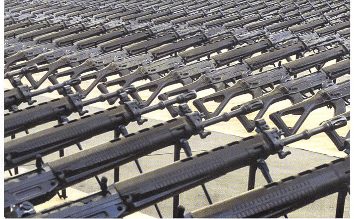
Diese Stgw 90 sind bereit zur Auslieferung.

reich. Wir führen keine Dual-Use-Produkte in unserem Sortiment. Waffen, Munition und Zubehör sind entweder zivil zugelassen, zum Beispiel für die Sportschützen, oder unterstehen dem Kriegsmaterialgesetz mit strikten Auflagen.