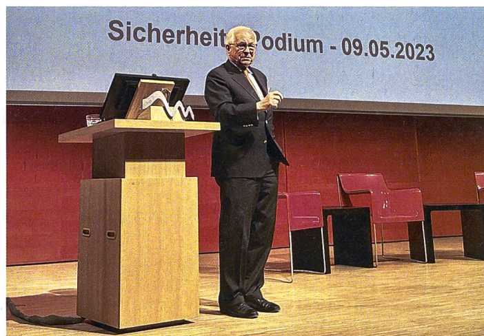
Der rote Faden in Wolfgang Ischingers Referat war die Sorge um ein US-Desengagement in Europa.

heitskonferenz, Prof. Dr. h.c. Wolfgang Ischinger. Er stellte fest, dass die mit der KSZE-Akte von 1974 (heute OSZE) geschaffene europäische Sicherheitsarchitektur durch den Ukraine-Krieg zerschlagen wurde. Russland arbeite seit 2007 systematisch daraufhin, den machtpolitischen Status quo zu überwinden. Der zu diesem Zweck lancierte Ukraine-Krieg dürfe noch lange dauern und am Ende – wie schon der Zweite Weltkrieg – durch die kriegswirtschaftliche Stärke der USA