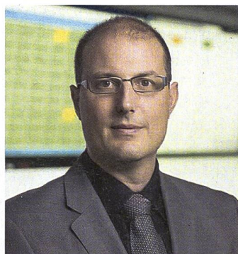
Florian Schütz wird das neue Bundesamt für Cybersicherheit leiten.

Der Bundesrat hat den heutigen Delegierten des Bundes für Cybersicherheit und Leiter des Nationalen Zentrums für Cybersicherheit (NCSC), Florian Schütz, per 1. Januar 2024 zum Direktor des neuen Bundesamtes für Cybersicherheit ernannt. Das heute dem Generalsekretariat des Eidgenössischen Finanzdepartement angesiedelte NCSC wird als neues Bundesamt ins Eidgenössische Departement