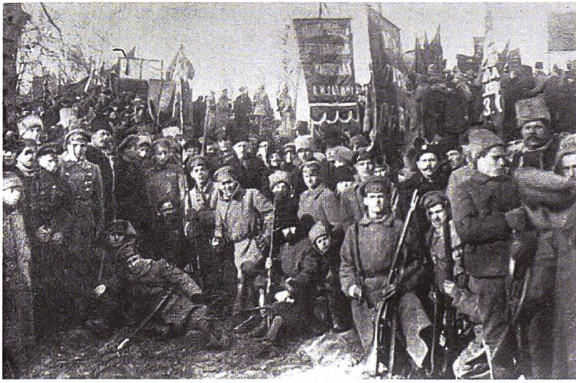
◀ Eine Gruppe von Aufständischen während der Kiewer Arsenalwerk-Revolte, die von Bolschewiki organisiert worden war. Sie begann am 29. Januar 1918 während des Sowjetisch-Ukrainischen Krieges und dauerte bis zur Erstürmung des Werks durch ukrainische Truppen am 4. Februar 1918.