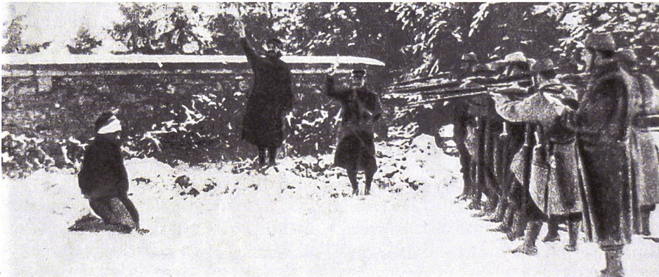
▼ Eine Exekution bei Verdun 1917 während der Meutereien unter französischen Truppen.

stilisiert wurde. Es folgte ein Bürgerkrieg. Lenin und seine Regierung gewannen ihn. Zu ihren treuesten Stützen gehörten die revolutionär gesinnten Matrosen. Doch nachdem der Krieg vorbei war, verlangten diese politische Lockerungen. Im März 1921 erhob sich die Marinebasis von Kronstadt. Matrosen bildeten ein revolutionäres Aufstandskomitee und verlangten freie Wahlen, die Freilassung aller politischen Gefangenen sowie Rede- und Versammlungsfreiheit für linke Parteien. Lenin liess die Revolte von der loyal gebliebenen Roten Armee niederschliessen.