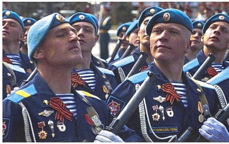
GRU-Speznas auf einer Parade: Auf den ersten Blick Fallschirmjäger – hellblaues Barett und das hellblau-gestreifte Unterhemd (Telnjashka); tatsächlich Kommandosoldaten unter Befehl der Militäraufklärung, Experten für Sabotage und Terror. Die aktive Mannstärke dürfte – wie zu besten Sowjetzeiten – an die 20 000 betragen. Die russische Armee unterhält eigene Luftlandetruppen, die nicht der GRU unterstehen.

Mit dem 24. Februar 2022 sind wir – nicht nur in Europa – in eine historische Zeitenwende eingetreten. Mit dem Zerfall des Warschauer Paktes und dem Auseinanderbrechen der Sowjetunion, wurde (vorerst) das Ende des Kalten Krieges und der bipolaren Weltordnung vollzogen. Deutliche Antworten, wie sich eine neue geopolitische Struktur entfalten könnte, lieferten die vorigen drei Jahrzehnte nicht. Wer sich der trügerischen Illusion, darunter auch hochrangige Militärs in ganz Europa, hingab, der Krieg gehöre auf unserem Kontinent endgültig der Geschichte an, wurde am 24. Februar 2022 (leider) eines Besseren belehrt. Der konventionelle, kinetische Krieg der verbundenen Waffen tobt nun seit über einhalb Jahren in Europa. Zwar mag er sich um Drohnen, Cyberwar und Electronic Warfare erweitert haben, doch am Ende bleibt das Ringen um die klassische Landnahme. Die Vorstellung vom sogenannten Cyber Soldier, der mit ein paar Mouse-Klicks die kritische Infrastruktur eines potenziellen Gegners oder ein paar Geldautomaten auf dessen Hoheitsgebiet lahmlegt und somit einem kinetischen Angriff den Wind aus den Segeln nimmt, hat sich als Hirngespinnst erwiesen.