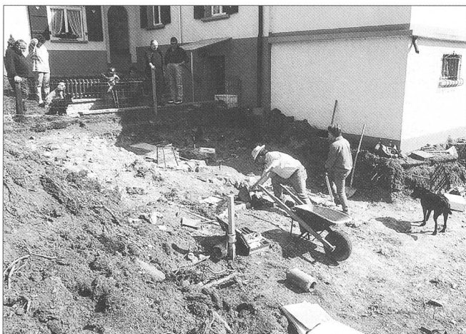
Abb. 2 Erschwil/Kirchgasse. Beim Hausbau kamen Fundamentreste der ehemaligen Kirche zum Vorschein.