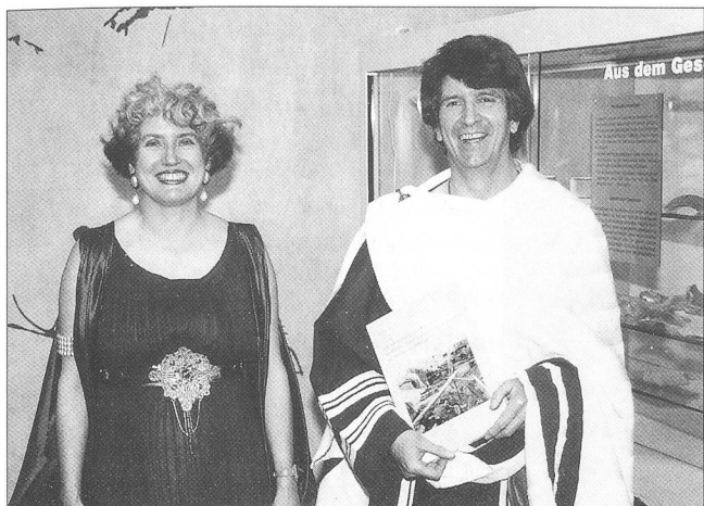
Abb. 5 Buchvernissage der Elite-Publikation in der Zentralbibliothek in Solothurn.