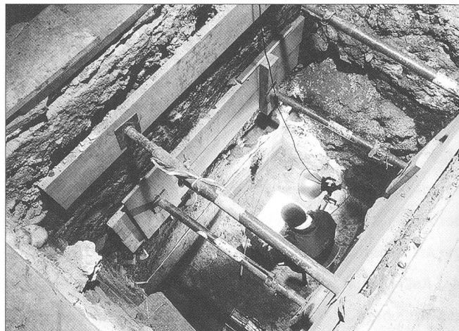
Abb. 3 Solothurn/Löwengasse 6. Sondierschnitt in der ehemaligen Breggerscheune mit über zwei Meter hohen mittelalterlichen und römischen Kulturschichten.

aktuell und wie korrekt, also wie brauchbar diese Inventare sind, ist aber schon weit schwieriger in einem Indikator darzustellen. Schliesslich, wie messe ich die Qualität einer Ausgrabung, wie diejenige einer wissenschaftlichen Publikation? Für den Betrieb sind die Erfahrungen aber insgesamt sehr positiv, weil – nicht nur in finanzieller Hinsicht – viel flexibler auf neue Situationen reagiert werden kann. Dazu kommt, dass unsere Vorgesetzten die Arbeit der Kantonsarchäologie viel besser wahrnehmen, aber auch wir selbst unsere Arbeit viel bewusster erleben.