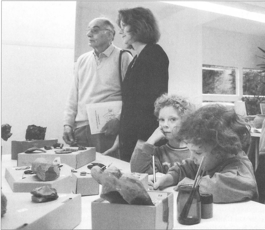
Abb. 7 Tag der offenen Tür in den Räumen von Denkmalpflege und Kantonsarchäologie.

zeitig waren in zwei Vitrinen einige der wichtigsten Funde zu sehen. Für den Führer durch das neue Steinmuseum im Kreuzgang der Jesuitenkirche verfassten wir zahlreiche Texte zu den jetzt dort, früher im sogenannten «Lapidarium I», ausgestellten römischen Inschriftsteinen aus Solothurn.