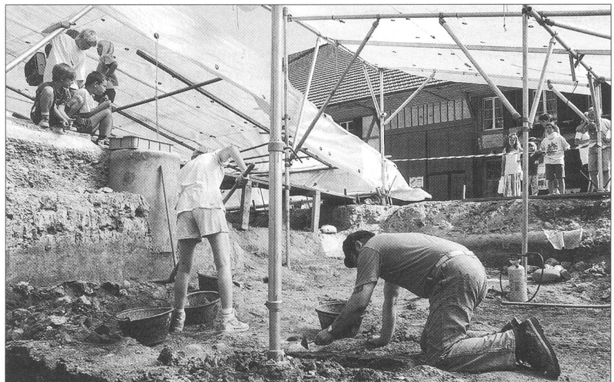
Abb. 1 Messen/Altes Schulhaus. Fortsetzung der Grabungen auf dem Pausenplatz im Sommer 1997.

1997 sammelten wir erste Erfahrungen mit WOV = Wirkungsorientierte Verwaltungsführung. An die notwendigen, zusätzlichen administrativen Aufgaben, wie die produktbezogene Arbeitszeitrapportierung – anfänglich von einigen als bürokratische Schikane empfunden –, haben wir uns längst gewöhnt. Der Aufwand dazu ist minim und der Rede kaum wert. Hingegen hat sich gezeigt, dass das Abfassen der quartalsweise abzuliefernden Controlling-Berichte jeweils recht auf-