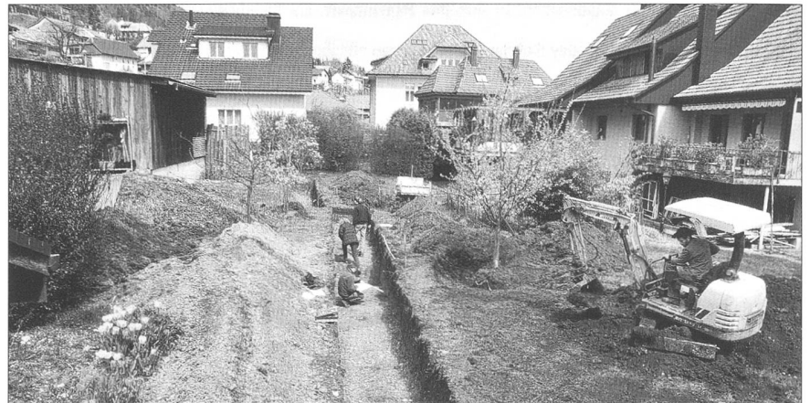
Abb. 3 Egerkingen/Martinsstrasse. In den Sondierschnitten treten die ersten römischen Siedlungsspuren auf.

steinzeitliche Archäologie hat er unterdessen begonnen, die Sammlungsbestände zu bestimmen und zu inventarisieren. Durch Vermittlung von P. Lätt, Konservator des Museums Buechschlössli in Kyburg-Buchegg, kamen auch einige, bislang dort aufbewahrte Bodenfunde aus dem Bezirk Bucheggberg in die archäologische Sammlung des Kantons Solothurn.