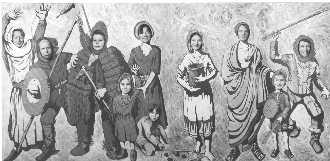
Abb. 5 Kostümwand aus der Ausstellung HÖHLE-CASTRUM-GROTTENBURG.

– HÖHLE-CASTRUM-GROTTENBURG, archäologische Streifzüge in Solothurn, (Medienorientierung, Vorpremiere, Vernissage). Städtische Museen Heilbronn, November 2001. Hanspeter Spycher