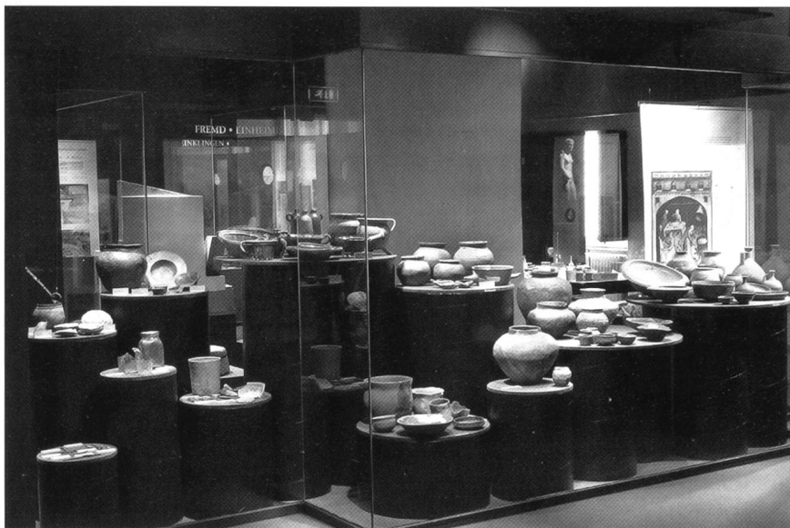
Abb. 5 Der «Küchenschrank der Geschichte» aus der Ausstellung HÖHLE-CASTRUM-GROTTENBURG im Historischen Museum Olten.

Da wir 2003 keine grösseren Ausgrabungen durchzuführen hatten, fielen auch die sonst zum Standardprogramm gehörenden «Tage der offenen Ausgrabung» weg. Umso aktiver waren wir im Bereich der Ausstellungen. Die zuvor in Heilbronn und in Solothurn gezeigte Ausstellung «HÖHLE-CASTRUM-GROTTENBURG, Archäologische Streifzüge im Kanton Solothurn» war im Historischen Museum in Olten (31.1.–4.5.2003), im Heimatmuseum Schwarzbubenland in Dornach (12.9.–26.10.2003) und schliesslich noch im Vindonissa Museum in Brugg (21.11.2003–25.4.2004) zu sehen (Abb. 5). Inhaltlich ergänzten wir für die einzelnen Standorte die ursprüngliche Ausstellung jeweils durch einen ortsbezogenen, regionalen Block. Darüber hinaus präsentierten wir unter dem Titel «Archäologie in Langendorf» im Dorfmuseum Langendorf vom 19.9.–27.12.2003 die Ergebnisse unserer Ausgrabungen im Hüslershofquartier (ADSO 8, 2003, 31–33).