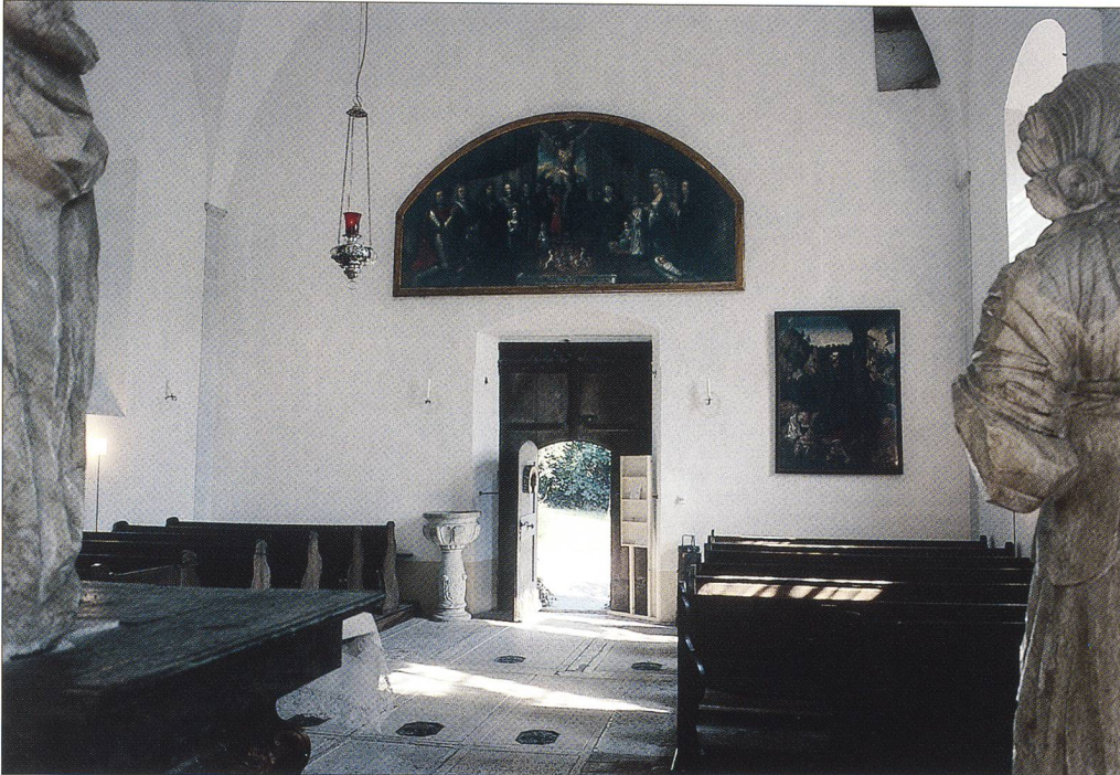
Abb. 2 Innenansicht, Blick nach Osten, nach der Restaurierung 2004.