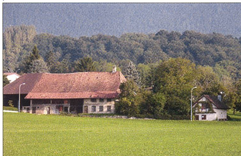
Abb. 7 Bellach, Selzacherstrasse 26, Südansicht 2006.

haltung gefunden werden konnte, wurde die provisorische Unterschutzstellung nach der Dokumentation und baugeschichtlichen Analyse der Baute aufgehoben.