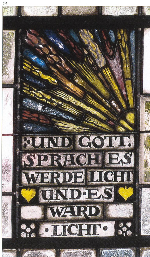
Abb. 14 Fenster Schiff, Detail.

zwei Durchbrüche, die in einer modernen, möglichst neutralen Art gestaltet wurden. Der grösste bauliche Eingriff erfolgte am Boden mit einem neuen Parkett in geräucherter Eiche. Darin eingelegt sind die Lüftungsöffnungen für die Heizung. Diese dienen gleichzeitig als Bestuhlungshilfen. Zusätzlich wurde das Chorpodest gegen das Schiff hin vergrössert. Auf die aus der Bauzeit stammende Bestuhlung wurde verzichtet. Sie bestand aus überlangen Bänken, denen weder formal noch handwerklich eine hochstehende Qualität attestiert werden konnte. Die Architekten entwarfen neue, kleinere Bänke, die je nach den Anforderungen unterschiedlich ange-