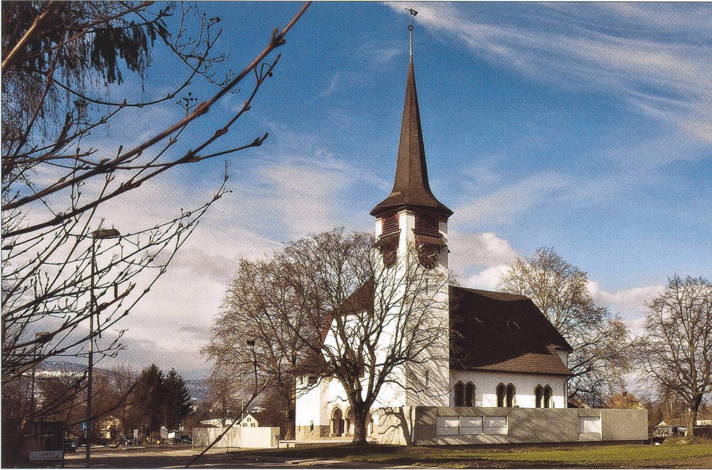
Abb. 11 Äusseres nach der Restaurierung, mit Neubau.