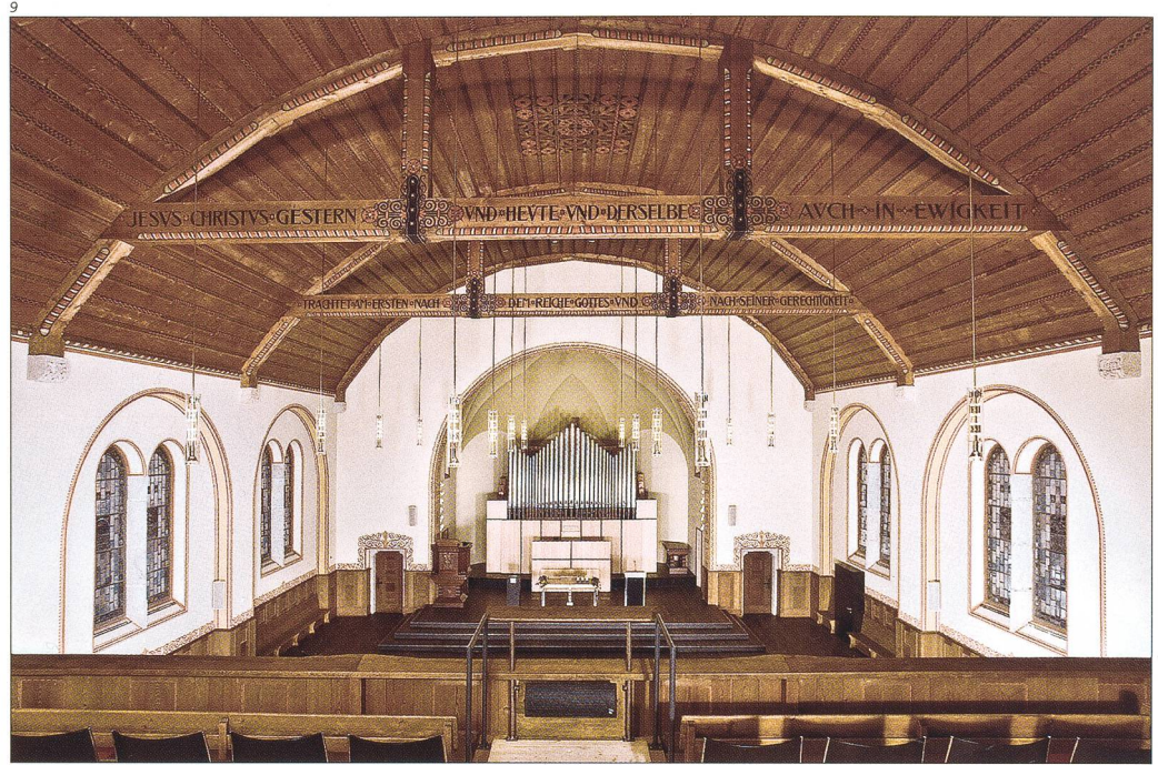
Abb. 10 Inneres nach der Restaurierung, Blick zur Empore.