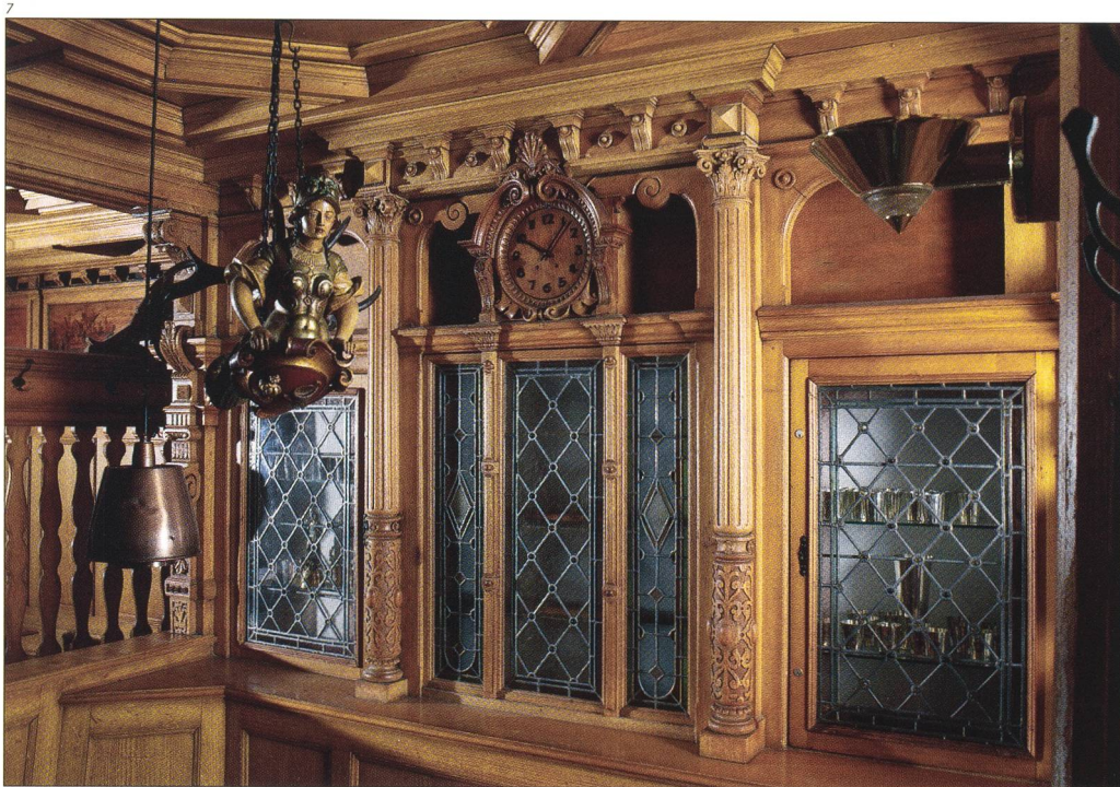
Abb. 7 Detail des Gaststubeninterieurs von 1888. Buffetrückwand mit Säulendekor und Uhr.