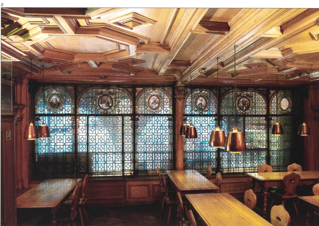
Abb. 8 Ansicht der 1888 von Adolf Kreuzer gestalteten Gasttrennwand zwischen Gaststube und Laubenbereich. 2006 entfernt und an den Seitenwänden der Laube in Fragmenten montiert.

maler Adolf Kreuzer gestaltete Trennwand zwischen Gaststube und Laube entfernt wurde (Abb. 8). Der Zugang zur Gaststube erfolgt jetzt neu über die um einige Treppenstufen tiefer liegende Laube.