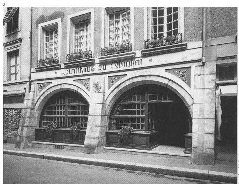
Abb. 2 Ansicht des Laubenbereichs nach den Einbauten von 1950.