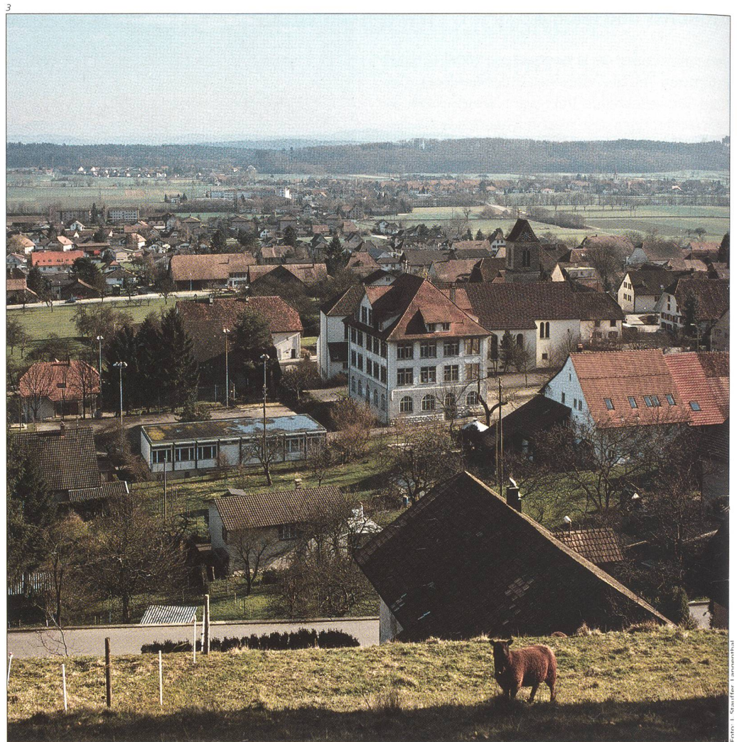
Abb. 3 Blick auf den Dorfkern von Oberbuchsiten mit der Kirche. Gegen Süden.