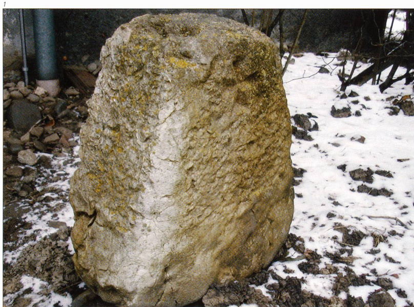
Abb. 1 Der Marchstein vom «Zälgli» (Gem. Grenchen) mit dem eingemeisselten Tatzenkreuz.

Im Breitholz nördlich des Naturschutzgebietes Grenchner Witi breitete sich bis ins 19. Jahrhundert ein mächtiger Eichenwald aus, der Bern und Solothurn gemeinsam gehörte. Seine Bedeutung für die Wirtschaft zeigen die zahlreichen Ausmarchungen und Erneuerungen der Grenzpläne. Die meisten zugehörigen Marchsteine gingen im Laufe der Zeit verloren. Einer davon kam im Jahre 2003 im Zälgli westlich des Grenchner Flughafens wieder zum Vorschein.