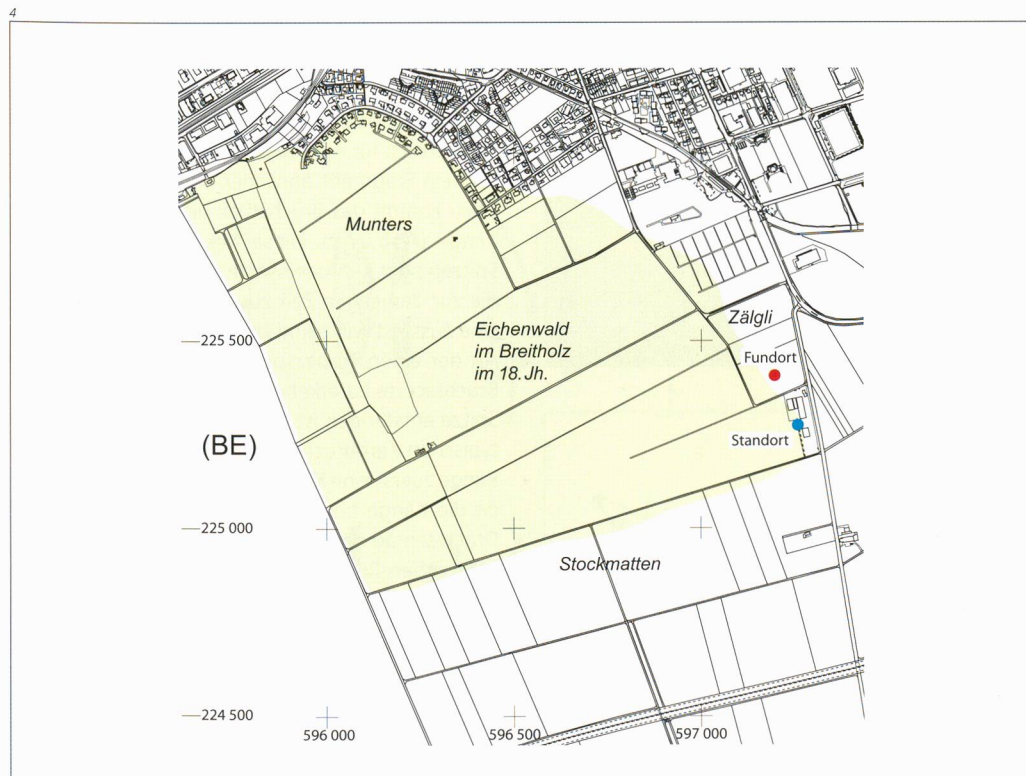
Abb. 4 Situationsplan mit dem Fundort (rot) und dem mutmasslichen ehemaligen Standort (blau) des Marchsteines. Grün ist die ungefähre Ausbreitung des Eichenwaldes im Breitholz im 18. Jh.