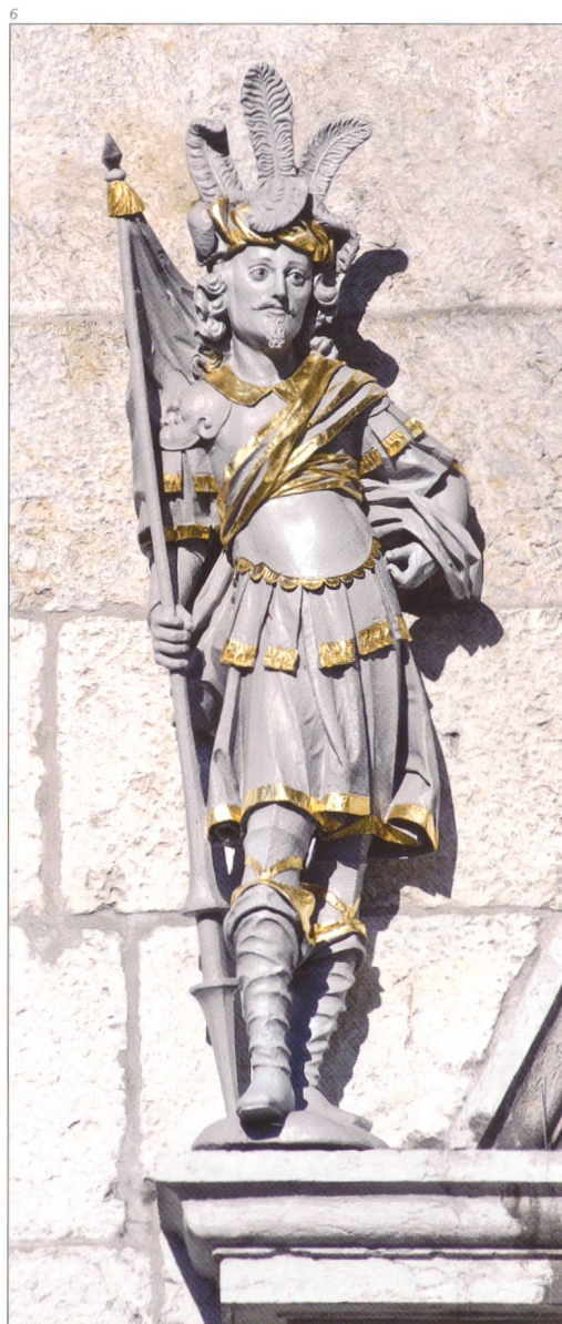
Abb. 7 Die Figur des hl. Viktor nach der Aufstellung, mit wieder hergestellter Fassung, Vergoldung und Gesichtszeichnung. Foto 2011.