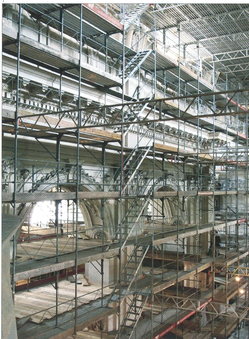
Abb. 1 Solothurn, St.-Ursen-Kathedrale. Innenraum während der Restaurierung 2011/12.