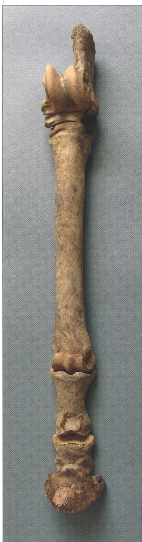
Abb. 3 Linker Hinterlauf vom Pferd im Keller 3b.

Ein ungewöhnliches Resultat ergibt die Skeletteilanalyse der Schaf- und insbesondere der Ziegenknochen. Hier fallen 97 abgehackte Hornzapfen auf, die fast 50 Prozent aller Funde dieser beiden Tierarten ausmachen. Hornzapfen sind von vielen Blutgefässen durchzogene knöcherne Ausstülpungen des Schädels, auf denen die eigentlichen, aus Keratin bestehenden Hornscheiden sitzen. Andere Skeletteile, wie zum Beispiel die Metapodien, sind dagegen nicht über- oder unterrepräsentiert (Abb. 4). Bei den Hornzapfen handelt es sich bis auf wenige Ausnahmen um meist ganze Exemplare von fast immer weiblichen, ausgewachsenen Ziegen. Die Dominanz von weiblichen Tieren ist vermutlich darauf zurückzuführen, dass fast alle männlichen Tiere vor Erreichen der Geschlechtsreife geschlachtet wurden. Die Hornzapfen wurden alle so abgehackt, dass jeweils noch ein kleines Hirnschädelstück direkt an der Zapfenbasis verblieb (Abb. 5). Die übrigen Teile des