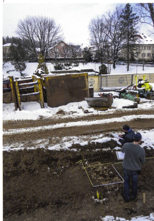
Abb. 1 Baubegleitung im Februar 2015. Mitarbeiter der Kantonsarchäologie dokumentieren ein Fundament des Nebengebäudes D. Im Hintergrund ist oberhalb der Baustellenabschrankung eine rekonstruierte Mauer des Hauptgebäudes zu erkennen.

Bereits zwischen den Jahren 1923 und 1942 liessen verschiedene Fundmeldungen in der Umgebung des Föhrenwegs eine römische Siedlungsstelle vermuten. 1961 brachte dann die Umgestaltung des «Dreispitzes» in einen Park Teile eines römischen Gutshofs zum Vorschein (Abb. 2). Die Bauarbeiten ebneten das bislang als Spielwiese und als Pflanzgärten genutzte Areal zwischen Föhrenweg, Untergrundstrasse und Katzenhubelweg ein und brachten die Südfront des Herrschaftshauses A sowie das Nebengebäude B zu Tage (Abb. 3). Die Villa war in den Hang hinein gebaut und besass eine 16 Meter lange und 5 Meter tiefe Portikus mit zwei seitlich vorspringenden Eckbauten (Abb. 2). 1,8 Meter dicke Strebe- Pfeiler stützen die beiden 8,5 beziehungsweise