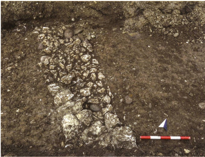
Abb. 6 Gebäude D: Das Fundament M3 zwischen Raum 1 und 2 mit Resten des aufgehenden Mauerwerks im Vordergrund.

(JSolG 49, 1976, 159). Diese Massangabe entspricht in etwa der Lage und auch der Breite von Raum 1. Man darf also annehmen, dass Raum 1 weiter südlich mit einem Ziegelschrotboden ausgestattet war (Abb. 3). Laut dem aktuellen Werkleitungsplan liegt die Leitung von 1974 an dieser Stelle knapp 10 Meter südlich des neuen Grabenverlaufs. Raum 1 war somit etwa 3,5 × mindestens 10 Meter gross.