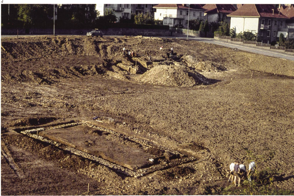
Abb. 4 Blick auf den «Dreispietz» im September 1961. Im Vordergrund das Nebengebäude B, oberhalb davon die Steinansammlung E. Im Hintergrund ist die Freilegung des Hauptgebäudes A noch in vollem Gange.