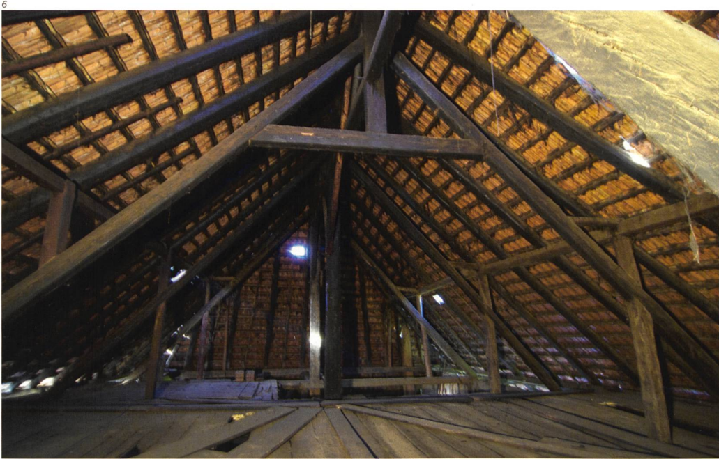
Abb. 6 Blick in den Dachboden mit Hochstudkonstruktion, Aufnahme 2013, vor der Restaurierung.