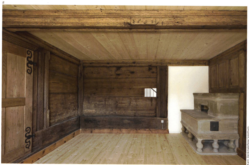
Abb. 10 Die Gartenseite des restau- rierten Bauernhauses.