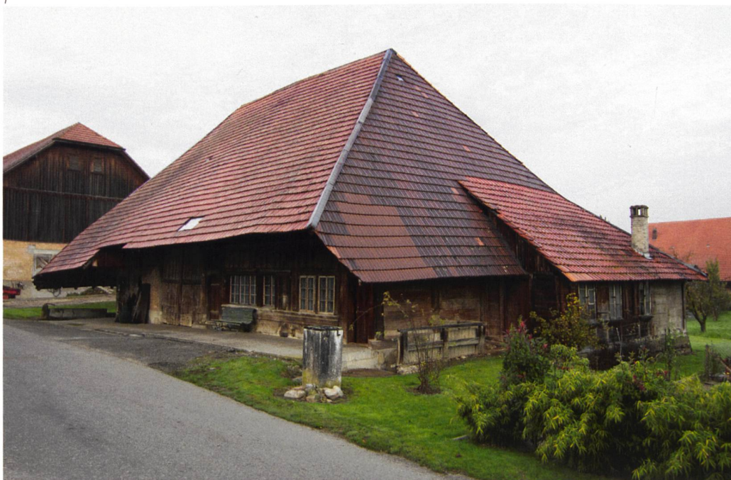
Abb. 1 Messen, Hochstudhaus Burggasse 10. Ansicht von Süden, in einer Aufnahme von 2006, vor der Restaurierung.

1995 und 1996 wollte die damalige Eigentümerin das 1942 unter kantonalen Denkmalschutz gestellte historische Kulturobjekt abbrechen. Nach einer Bau-