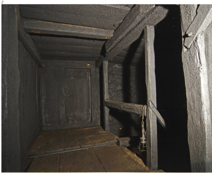
Abb. 2 Die verrusste Holzkonstruktion im Obergeschoss, Foto 2013.