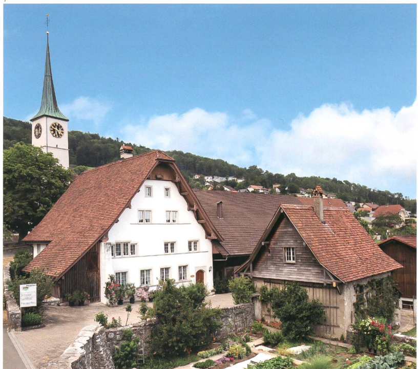
Abb. 1 Das Umschlagbild des Bandes 36 der Reihe «Die Bauernhäuser der Schweiz» zeigt das Pflugerhaus in Oensingen in einer Aufnahme von 2019.

aber bald wieder ins Stocken und blieb schliesslich während Jahrzehnten liegen. Erst im Jahr 1995 und dann noch einmal 2000 unternahm Benno Furrer, der Leiter der Schweizerischen Bauernhausforschung, zwei weitere – vorerst wiederum erfolglose – Anläufe, um im Kanton Solothurn ein Projekt zu starten. Immerhin löste seine Initiative aber die Inventarisierung der an ländlichen Bauten reichen Bezirke Bucheggberg und Wasseramt aus. Der auf diesem Gebiet erfahrene Kunst- und Architekturhistoriker Hansjürg Schneeberger erarbeitete diese im Auftrag der kantonalen Denkmalpflege von 2005 bis 2008.