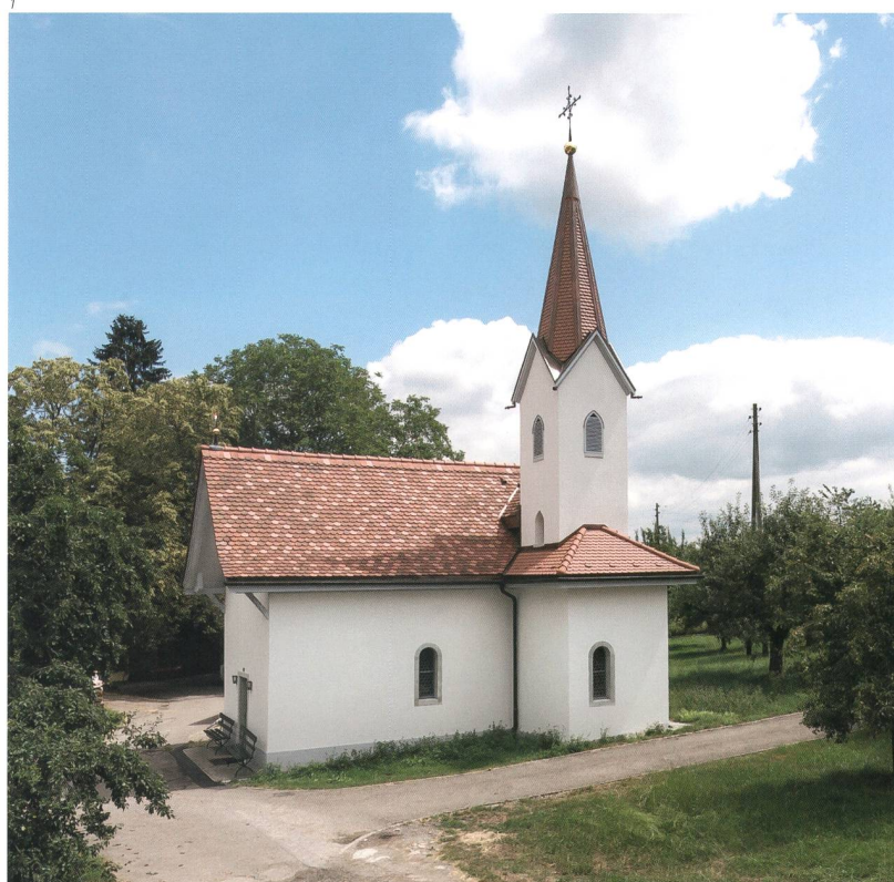
Abb. 1 Aeschi, Marienkapelle in Steinhof, Kirchgasse 11. Die in unverfälschter Umge- bung stehende Kapelle nach der Restaurierung von 2015–2018.

einrichten. Andere gläubige Steinhöfer schenkten ihm Land und halfen beim Bau der Kapelle, die die schwarze Madonna angemessen beherbergen würde. Heute gilt die Kapelle mit ihrer Madonnenfigur als Kraftort. Sie wird regelmässig aufgesucht, um zu beten, Kraft zu tanken und Einkehr zu üben. Damit ist sie ein Ort, der seit seiner Erschaffung besucht, geschätzt und gepflegt wird. Er hat Anteil am und im Leben vieler Menschen.