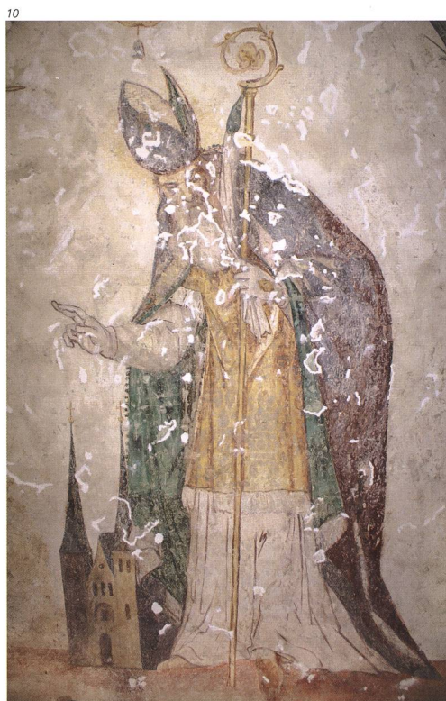
J. C. Märki Restaura, Büren a. A.

Abb. 11 Die Figur des Trophimus im Zustand nach der Restaura- tion. Die Retuschen wurden sehr zurückhaltend eingesetzt, sodass die Malerei nach wie vor eine authentische Alters- würde ausstrahlt.