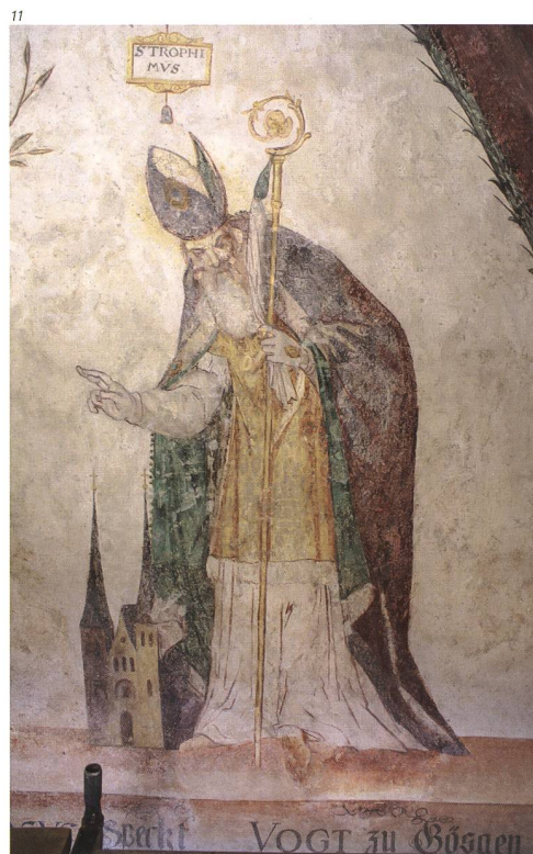
J. C. Märki Restaura, Büren a. A.

Sofern sie doch notwendig waren – etwa bei störenden Fehlstellen –, wurden die Retuschen in sogenannter Trateggiotechnik und mit reversiblen Materialien ausgeführt. Dabei stand aber immer das Ziel im Vordergrund, die Malerei in ihrer authentischen Alterswürde zu bewahren, gleichzeitig aber auch die Lesbarkeit der Darstellungen zu gewährleisten (Abb. 11).