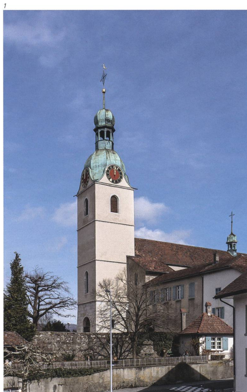
Abb. 2 Schönenwerd, ehemalige Stiftskirche St. Leodegar. Ansicht der Wandmalereien von Paul Wiederkehr in der Eingangshalle. Zustand nach der Restaurierung 2019.