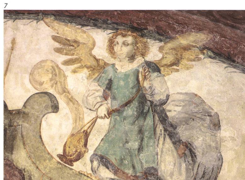
Abb. 7 Dieselbe Darstellung nach der Restaurierung 2019.