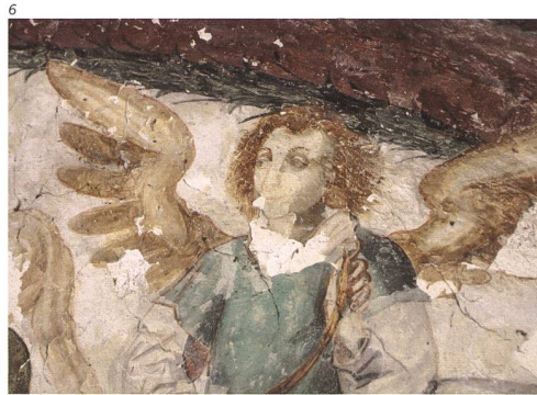
Abb. 6 Wandmalereidetail eines Engels im Bogenfeld über dem Portal, vor der Restaurierung.

Bevor eine Oberflächenreinigung vorgenommen werden konnte, mussten absturzbedrohte Malschichten zuerst vorgefestigt werden. Dazu injizierte der Restaurator mittels einer Spritze minutiös einen Kleber auf Basis eines Celluloseleims hinter die losen Farbschichten und fixierte somit die bedrohten Stellen (Abb. 8). Die anschliessende sorgfältige Reinigung der Wand- und Gewölbeoberflächen erfolgte mit Dachshaarpinseln (Abb. 9), Trockenschwämmen und teilweise mit destilliertem Wasser, bei hartnäckigen Fliegenexkrementen mit Hilfe von Wasserstoffperoxyd. Zur Sicherung und Festigung von teilweise pudernden Malschichten wurden diese mit Celluloseleim besprüht und auf den Grund zurückgedrückt. Hohlstellen im Putzuntergrund hintergoss der Restaurator mit Kalkmörtel, lose und bröselige Putzpartien verfestigte er mit Kieselsäureester, Fehlstellen ergänzte er ebenfalls mit Kalkmörtel (Abb. 10). Bewusst sehr zurückhaltend erfolgten Retuschen bei den figürlichen und architektonischen Malereien.