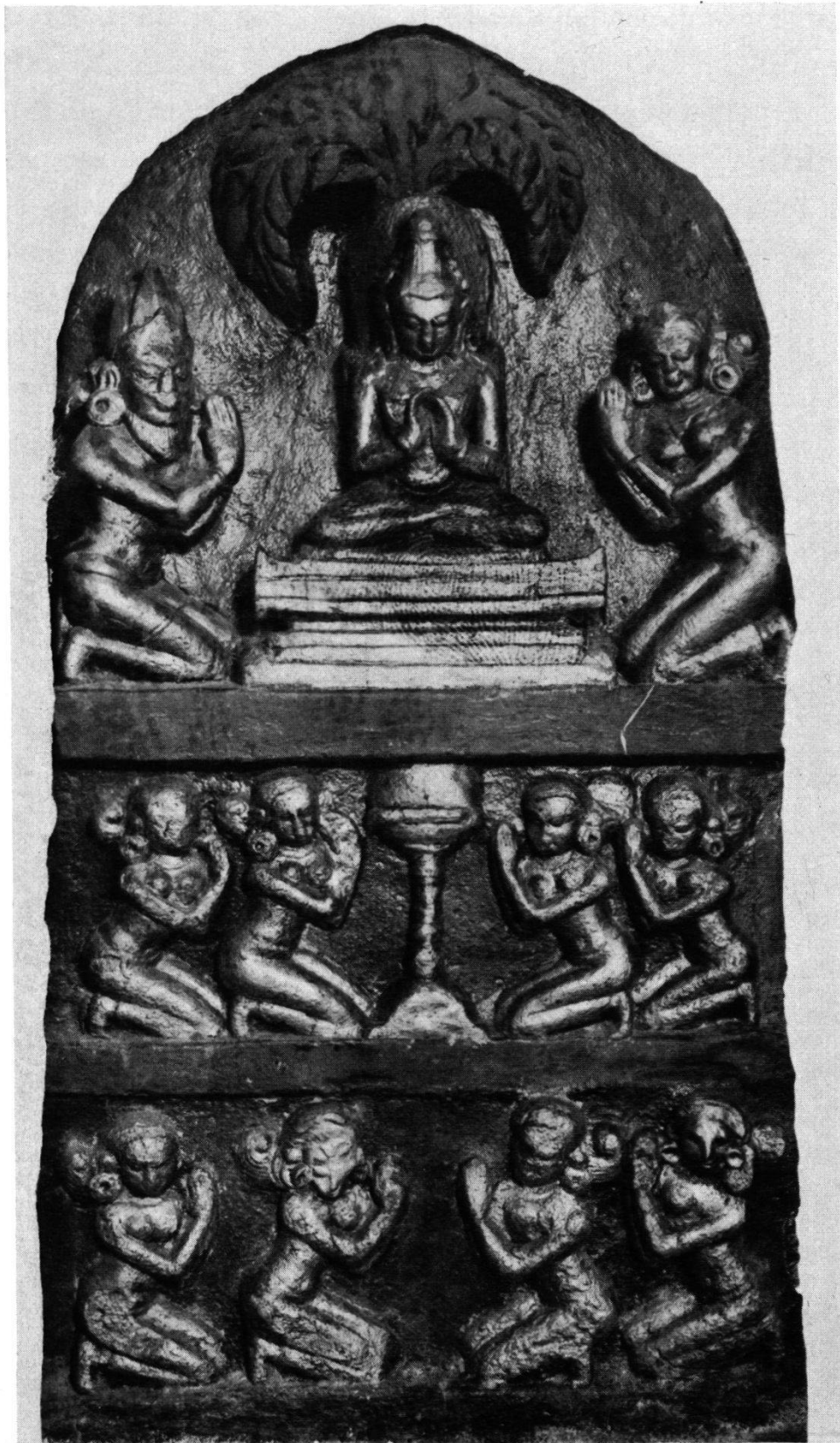
Tafel II. Buddhas Meditation