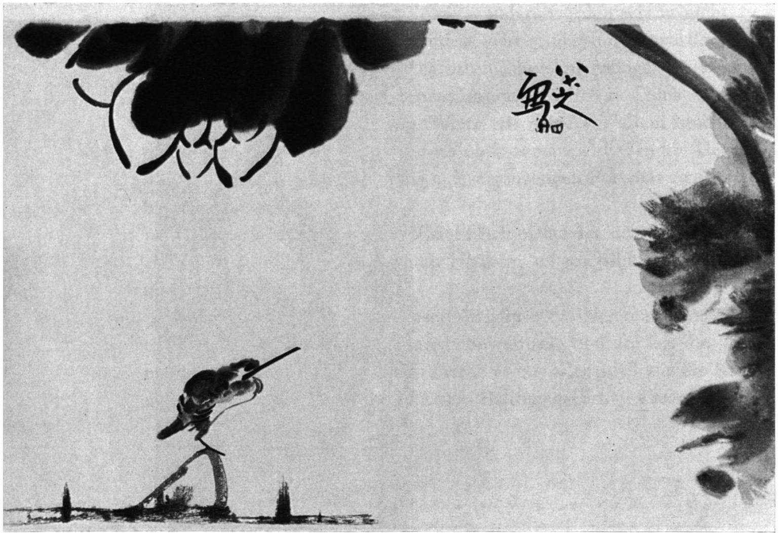
Fig. II. Tchou Ta, 1625-vers 1705, appelé aussi Pa-ta Chan-yen. Feuille d'album. Oiseau et Lotus . 24,5 × 38,5 cm.