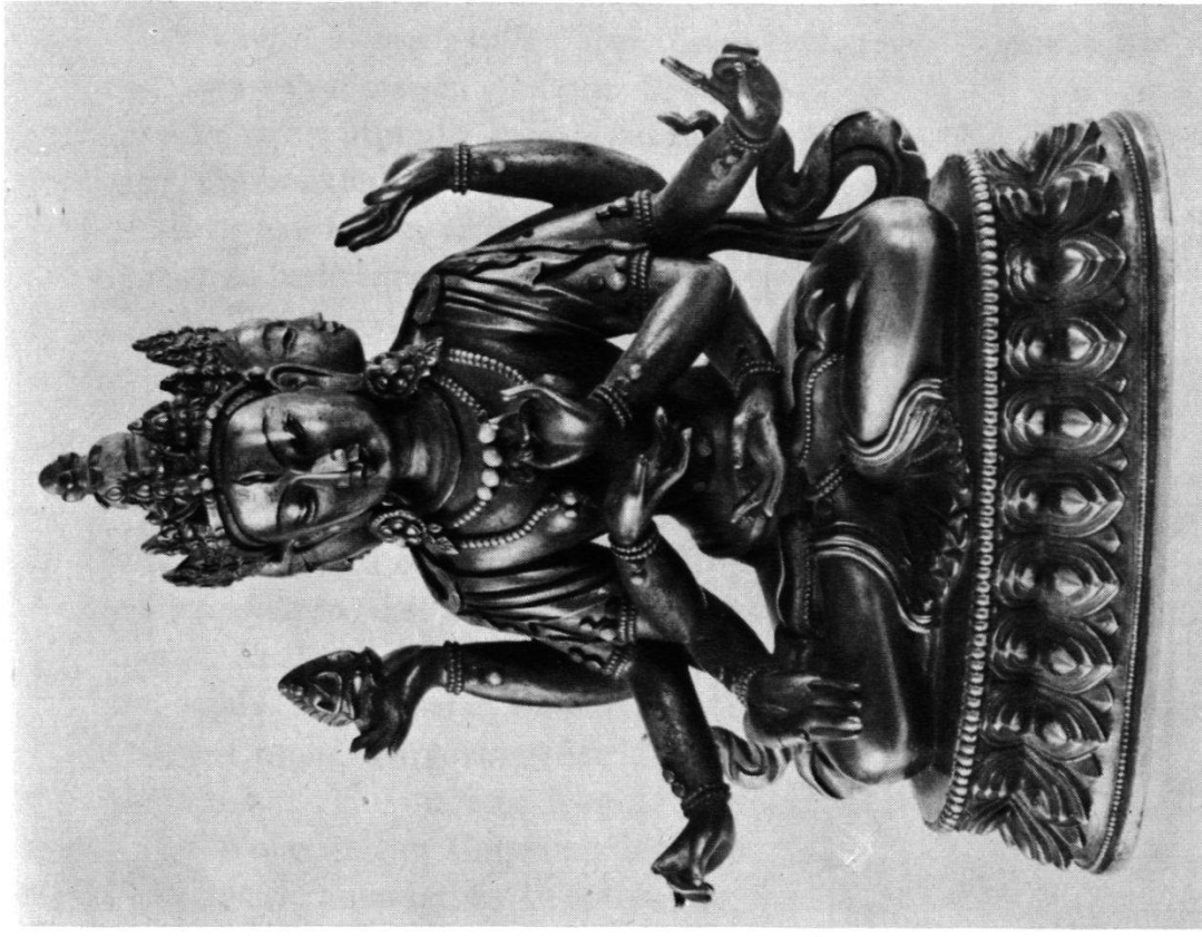
Ushnīshavijayā (Sammlung G. Markert, München).