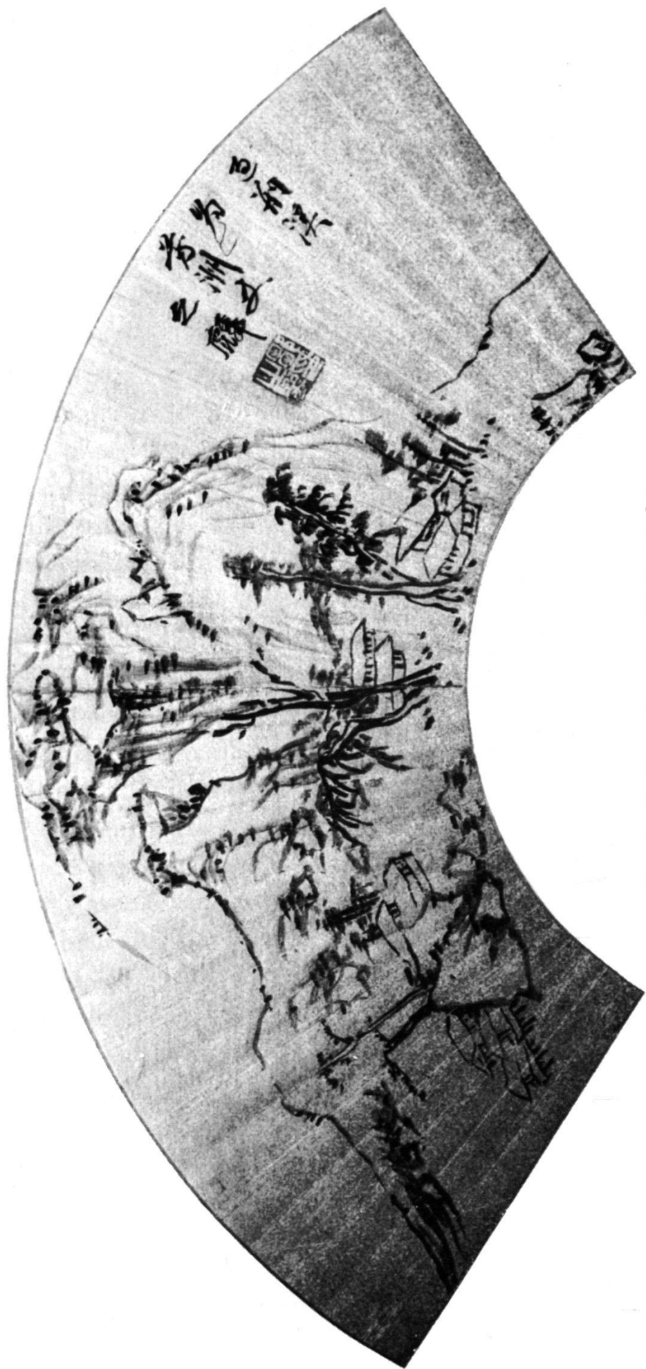
Planche II. Tsou CHIH LIN (XVII e siècle)