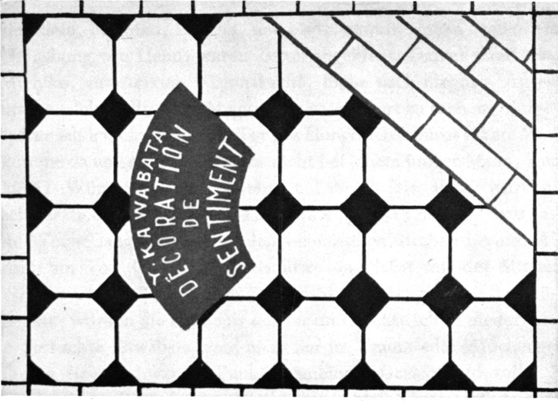
Schuber und vorderer Buchdeckel der ersten Ausgabe des Kanjō Sōhoku , 1926