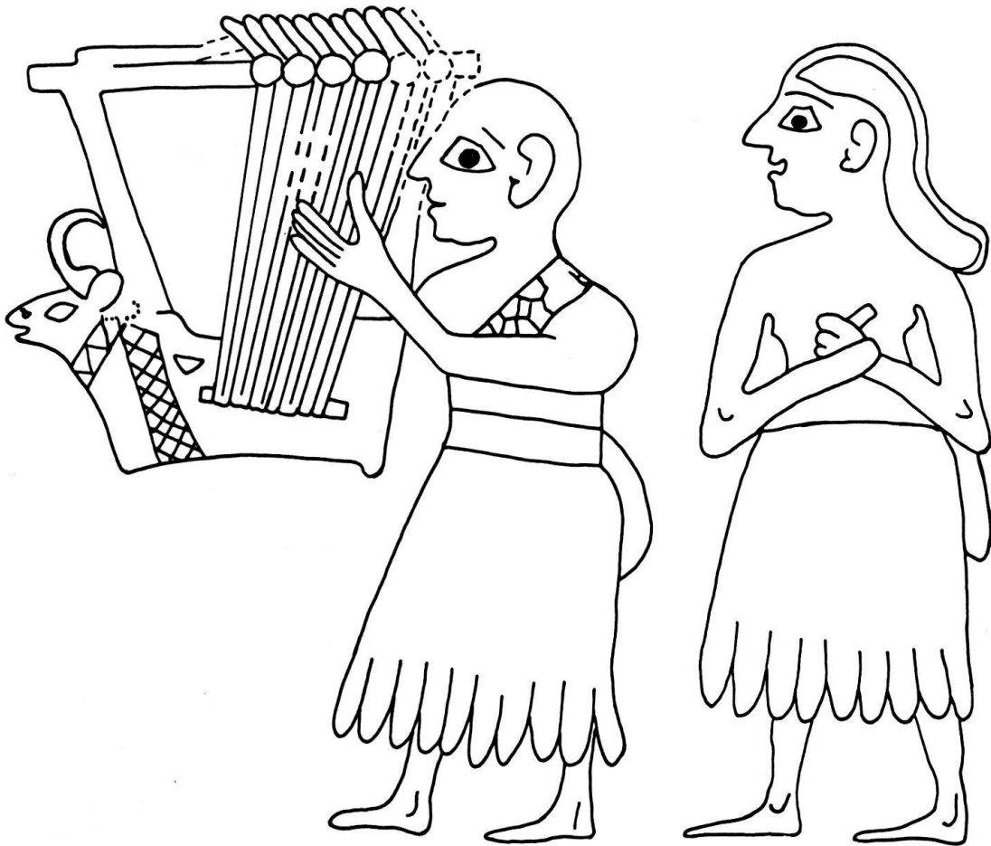
Sumerischer Leierspieler und Sänger von der sogenannten Mosaikstandarte aus Ur in Mesopotamien (Mitte des 3. Jahrtausends v.Chr.); Nachzeichnung, dem Begleitheft zur Schallplatte «Sounds from Silence» entnommen.