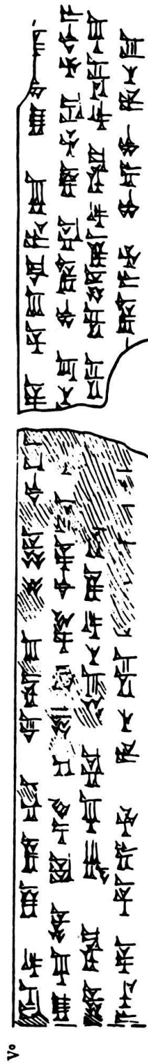
Keilschrift-Autographie der Tontafel RS 15.30 + 15.49 + 17.387 aus Ras Schamra (Ugarit) nach E. LAROCHE.