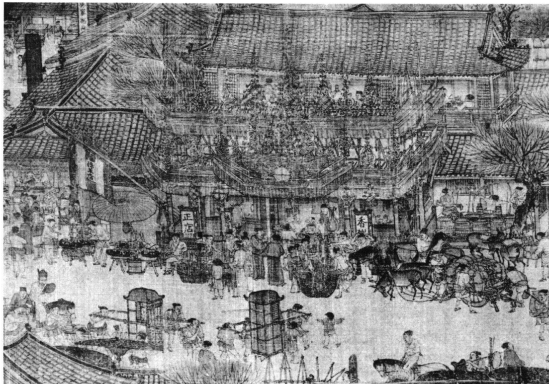
Abbildung 1 und 2: Zhang Zeduan, Qing ming shang he tu . (Palastmuseum in Beijing, Rep. Hong Kong.)