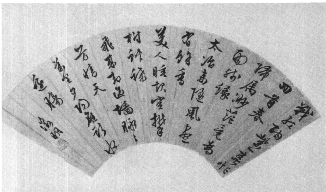
Fig.3. Poème calligraphié de Wen Zhengming. Huitain heptamétrique.