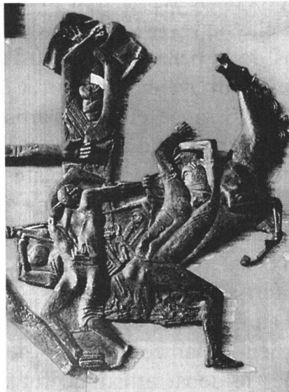
Ill. no. 3: Ğawād Salīm (1919-1961), Naşb al-ḥurriyya (Monument à la liberté) , 1962, Bagdad, Place Taḥrīr (détail)

Pour célébrer le troisième anniversaire de la Révolution républicaine de 1958, le gouvernement irakien chargea Ğawād Salīm de l'exécution d'un monument destiné à commémorer l'événement. L'artiste le conçut en tant que panneau se lisant de droite à gauche (comme les écritures sémitiques), référence à l'art assyro-babylonien. Il s'agit en effet d'un bas-relief qui, comme ses ancêtres mésopotamiens, doit être lu et qui raconte une histoire: celle de la vie en Irak avant et après la révolution. Alors que les personnages d'avant la révolution sont réels et expriment le plus souvent la douleur (le martyr, le prisonnier, la pleureuse) mais aussi l'espoir (la mère et l'enfant, le soldat), l'après est représenté par des concepts abstraits, tels la Liberté, l'Agriculture, l'Industrie, etc. Une influence de type réalisme socialiste est perceptible; toutefois, Salīm réussit à rester assez sobre.