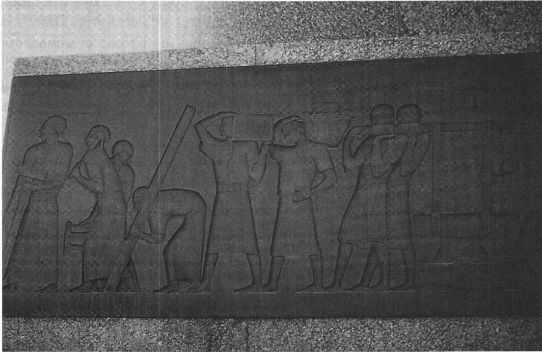
Ill. no. 1: Maḥmūd Muḥtār (1891-1934), Monument à Sa'd Zaḡlūl , 1930-32

Frise décorant le socle du monument du Caire (détail).