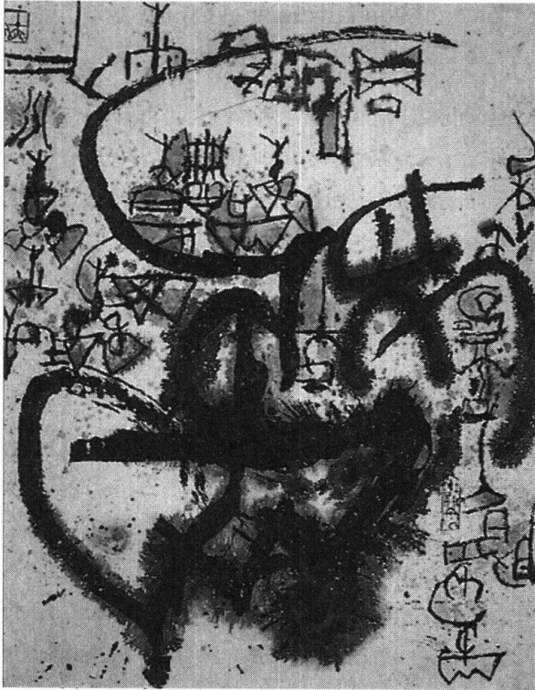
Abb. 1: Gu Gan (geb. 1942), Glänzende Zukunft , Tusche und Farben auf Papier, 68 x 53cm.