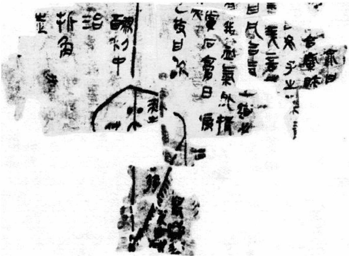
Abbildung 2: Vulva-Diagramm aus Yang Sheng Fang : Unteres Drittel des Seidenstücks.

Einige weitere Hinweise zur Deutung liessen sich aus der wahrscheinlich ältesten in China erhaltenen Linienzeichnung der Vulva gewinnen, die sich stark zerfetzt am Ende des Seidenmanuskripts Rezepturen zum Nähren des Lebens ( Yang Sheng Fang 養生方) findet (Abbildung 2). Kurioserweise markiert die Mittellinie des Körpers und der Vulva auch das Textende rechts der Mittellinie, links davon steht das Inhaltsverzeichnis. Im unteren Teil des Seidenstücks liegt dann das birnenförmige Diagramm der Vulva.