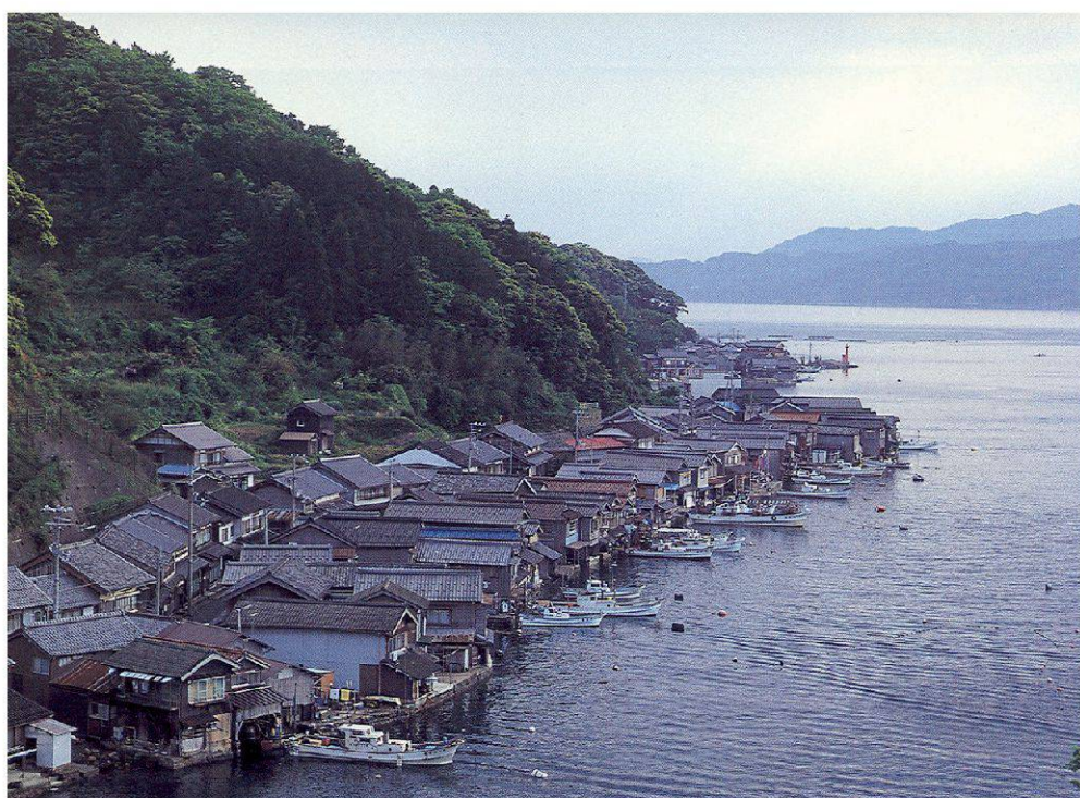
Das Fischerdorf Ine-chō an der Wakasa-Bucht, Kyōto-Präfektur. Einzigartiges Beispiel für Sato-umi (Meerheimat).