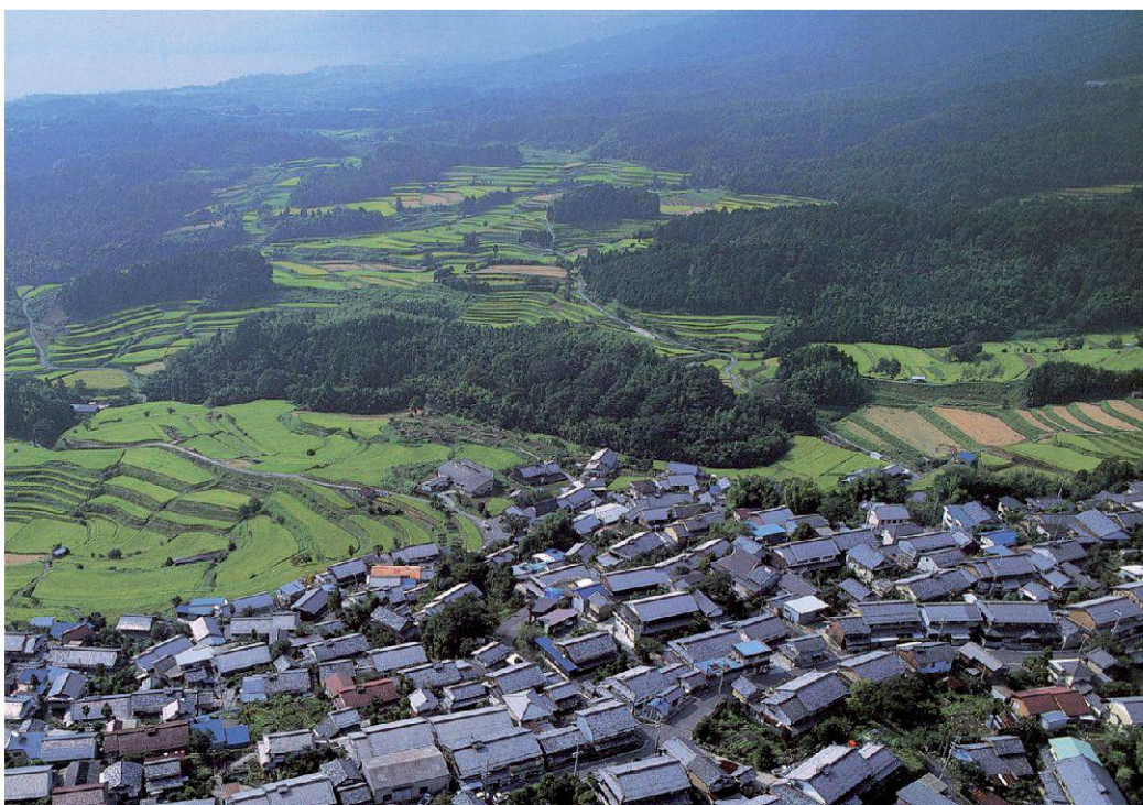
Das Dorf Ōgi-chō, Shiga-Präfektur, mit Terrassenfeldern und Wald. Im Hintergrund der Biwa-See