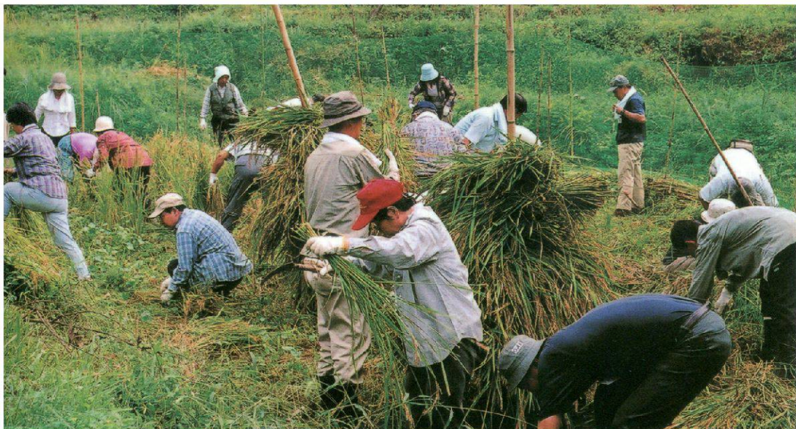
Eine Gruppe der NPO Tanzawa donkai, Kanagawa-Präfektur, im Freiwilligen-Einsatz.