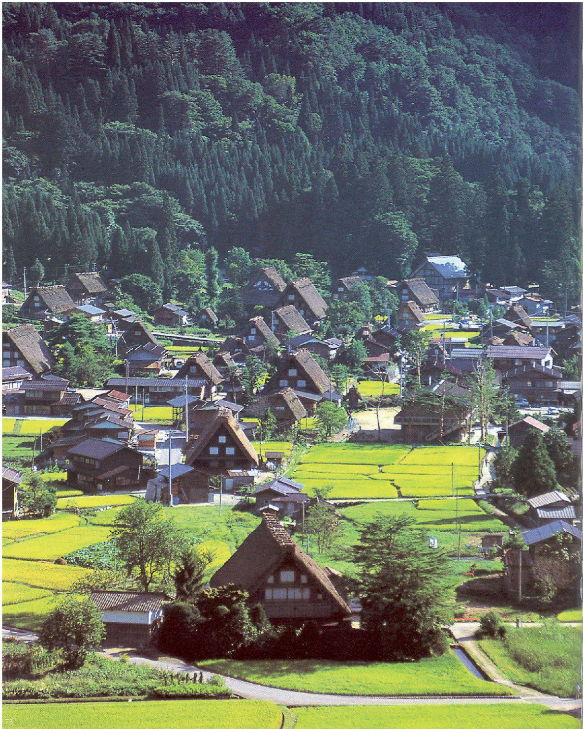
Das Dorf Shirakawa, Gifu-Präfektur, mit den für diese Siedlung typischen mehrstöckigen Giebelhäusern.