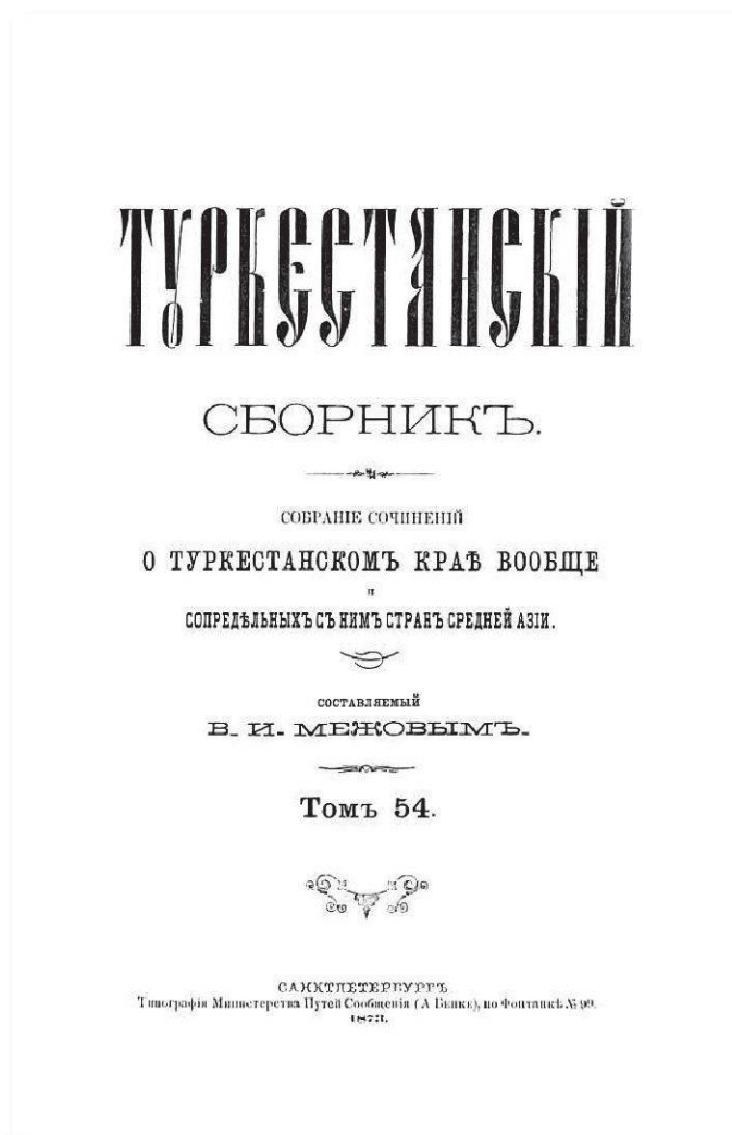
Figure 1: Couverture du volume 54 du Recueil Turkestanais

d'étude sera celui du dit Recueil turkestanais ( Turkestanskij sbornik ) 13 compilé par le bibliographe Vladimir Izmajlovič Mežov (1830–1894). 14