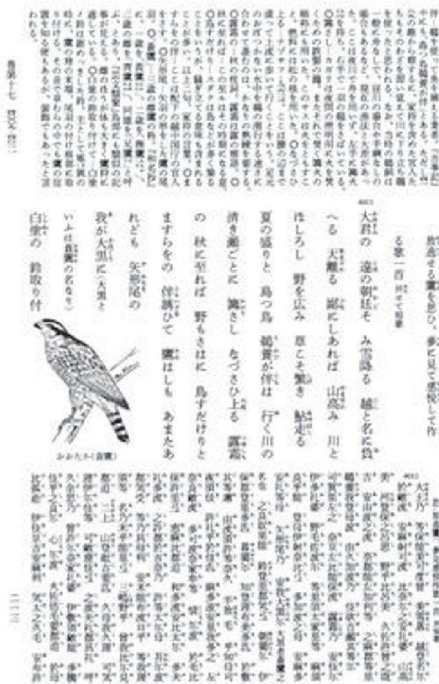
Abbildung 2: Seitenaufbau der Shōgakukan-Ausgabe

entweder auf einzelne Wörter und Phrasen oder auf das gesamte Gedicht. In der Mitte findet sich die Transliteration der Originaltexte, gelegentlich auch Illustrationen oder Abdrucke aus den Quellentexten. Diese Transliteration (Transkription) wird auf Japanisch kaki-kudashi genannt, das "Herunterschreiben" bzw. das "Heruntergeschriebene". Es geschieht nahezu in der heutigen Aussprache, geht jedoch auf die oben erwähnte "Übersetzung" und spätere Arbeiten zurück.