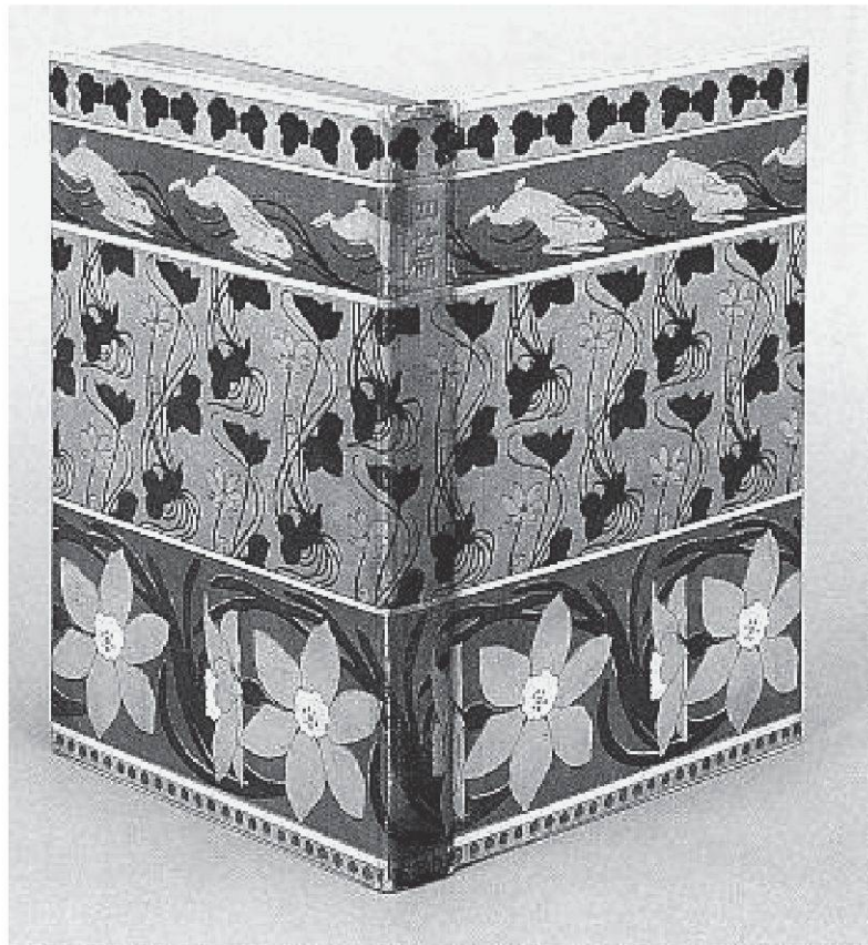
Abbildung 1: Von Hashiguchi Goyō illustriertes Sōsekis Shihen

Sōseki interessierte sich seinerseits für die kunstgewerbliche Richtung in England, the arts and crafts movement , die mit dem art nouveau und dem Jugendstil verwandt ist, und nahm nach seiner Rückkehr Einflüsse davon in seinen Werken auf. Sōseki zeigte vermutlich die mitgebrachten Zeitschriften, z.B. Studio usw. einem jüngeren Ölmaler, dessen Bruder er in seiner Kumamoto-Zeit unterrichtet hatte. Dieser Maler hiess Hashiguchi Goyō (橋口五葉), der später Zeichner wurde. Er siegte im Plakatwettbewerb von Mitsukoshi (三越; bald danach das erste grosse Kaufhaus in Japan) und illustrierte zugleich die sechzehn Bücher von Sōseki (Abbildung 1).