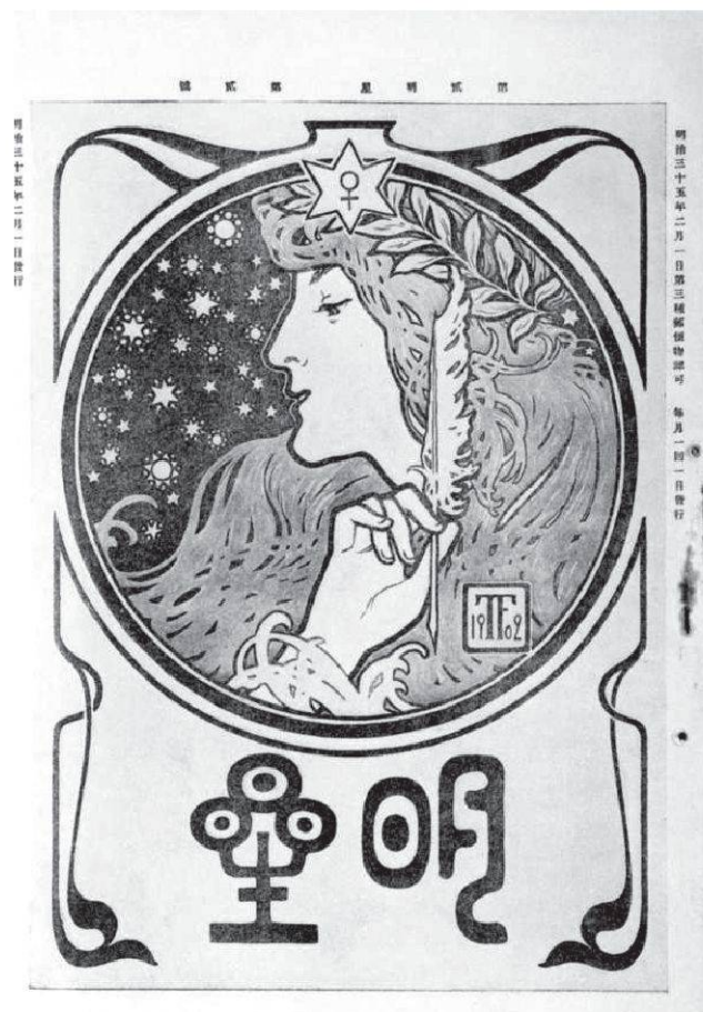
Abbildung 3: Fujishima Takejis Illustrierung von Myōjō

Der Unterschied zwischen Asai und Sōseki verweist auch auf den Fortschritt der Modernisierung. Asai ist elf Jahre älter als Sōseki. Der Maler Fujishima Takeji (藤島武治), der im selben Jahre 1867 wie Sōseki geboren war, gestaltete eine damalige Literaturzeitschrift Myōjō (明星) (Abbildung 3).