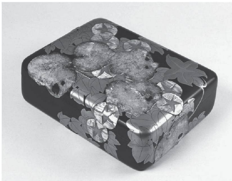
Abbildung 2: Von Asai Chū entworfenes Asagao-maki-e tebako

Lassen Sie uns nun zum Unterschied zwischen Sōseki und Asai zurückkehren, in deren Aneignung der Kunst um die Jahrhundertwende eine Differenz besteht. Diese bezieht sich auf die Sinnlichkeit als die Wesensart dieser Kunst. Asais Design im Stil des art nouveau behält zwar oft die organischen Formen, z.B. die botanischen (Abbildung 2), aus dem ursprünglichen art nouveau , aber fast keine Formen der Weiblichkeit.