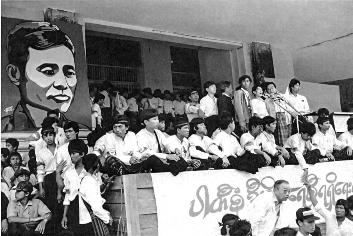
Abbildung 1: Aung San Suu Kyi bei ihrem ersten großen öffentlichen Auftritt am 26. August 1988.

Die im November 2010 abgehaltenen Wahlen unter dieser Verfassung wurden von Aung San Suu Kyi und ihrer Partei boykottiert, die sie ebenso für undemokratisch hielten wie das Wahlgesetz. Einer der Hauptgründe für diese Einschätzung war die Tatsache, dass sich das Militär in der Verfassung eine langfristige Einflussnahme auf die Politik des Landes vorbehalten hatte. So wurde ein Viertel aller Abgeordneten in allen Parlamenten des Landes vom Oberkommandierenden des Militärs bestimmt. Verfassungsänderungen konnten danach nicht gegen den Block der Parlamentarier in Uniform verabschiedet werden.