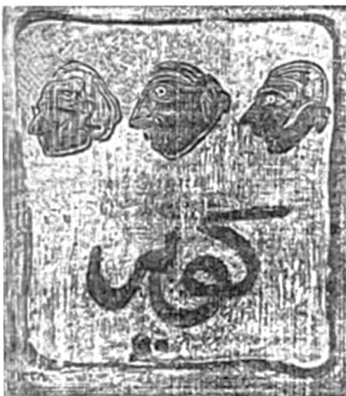
Illustration 5: Couverture de la revue Désert ( Kavir ).