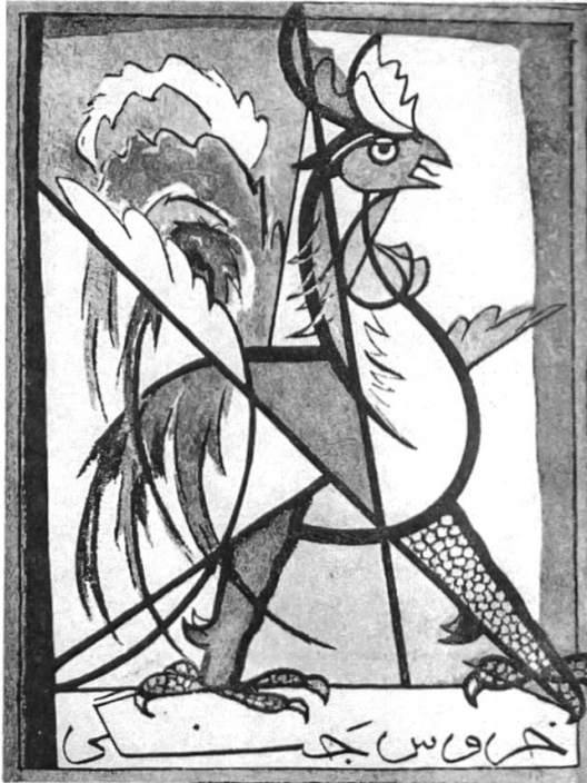
Illustration 3: Couverture de la revue Coq combattant ( Khorus-e jangi ), dessin de Jalil Zia'pur, 1949.