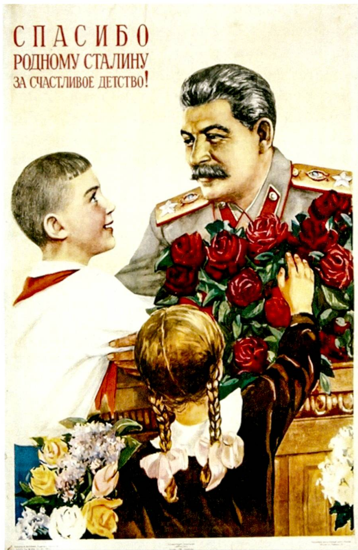
Abbildung 1: Sowjetische Bildpostkarte aus dem Jahre 1939.

„Wir bedanken uns beim Genossen Stalin für unsere glückliche Kindheit!“ 2 (siehe Abbildung 1) 3 war eine der vielen ideologischen Losungen auf den Transparenten, die in der gesamten Sowjetunion gewöhnlich während der Demonstrationen getragen und an den Häuserfassaden angebracht wurden. Eben jene Parole tauchte wiederum als Refrain in zahlreichen Artikeln der sowjetischen Presse und diversen Fachpublikationen der Zeit auf, welche sich