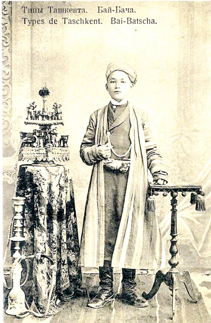
Abbildung 4: Russische Ansichtskarte «Types de Taschkent. Bai-Batscha».

hier aufgeführte Ansichtskarte („Types de Taschkent. Bai-Batscha“) deutlich veranschaulicht (siehe Abbildung 4). 48