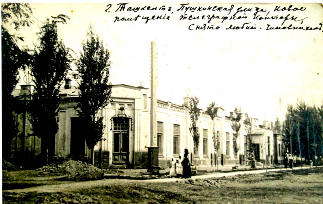
Abbildung 8: Russische Ansichtskarte „Taschkent, Telegrafenamt“.

Eine weitere, ausserordentlich einflussreiche Referenzgruppe rekrutierte sich aus den Vertretern des in Turkestan stationierten russischen Militärs. Führende Fotografen, die Turkestan fotografisch „dokumentierten“, kamen vor allem aus den Reihen des russischen Militärs. Zu der dritten Gruppe, hier gab es personelle Überschneidungen mit der Gruppe des Militärs (Mittelasien als ans Ausland grenzendes Gebiet wurde als General-Gouvernement – d. h. von den Militärs – verwaltet), gehörten russische Beamte (siehe Abbildung 8, auf dem der damalige Absender anmerkte: „Stadt Taschkent, Puschkin-Strasse, Neubau des Telegrafenamtes, aufgenommen durch einen Beamten-Amateurfotografen“): 76