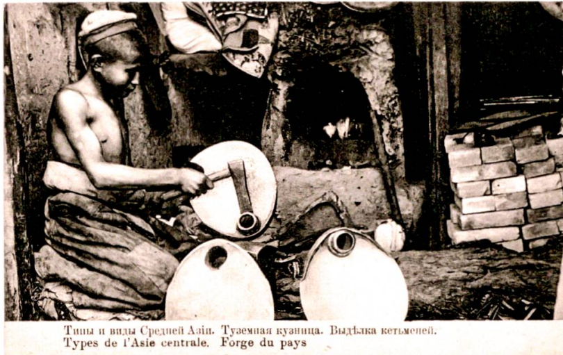
Abbildung 14: Russische Ansichtskarte «Types de l'Asie centrale. Forge du pays».

Das dritte Merkmal (recht frühe Integration von Kindern in die Arbeitswelt) ist ebenfalls oft zu erkennen, z. B. auf der Ansichtskarte „Types de l'Asie centrale. Forge du pays“ (siehe Abbildung 14) oder auf der Ansichtskarte „Kokand. Kindermusikanten“ (siehe Abbildung 15): 104 „... Einmal waren die Kinder im alltäglichen Leben mitten unter den Erwachsenen, und an allen alltäglichen Anlässen wie der Arbeit, dem müßigen Umherschlendern oder auch dem Spiel nahmen Kinder und Erwachsene gemeinsam teil ...“ 105