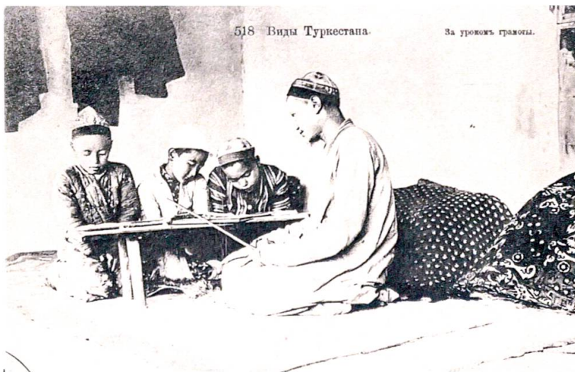
Abbildung 13: Russische Ansichtskarte «518 Vidy Turkestana. Za urokom gramoty», dt.: „518 Ansichten von Turkestan. Während eines Alphabetisierungskurses“.

bekannt ist, 100 wird fälschlicherweise als „Schule“ übersetzt. Sie war jedoch nur dem Namen nach eine Schule; in Wirklichkeit handelte es sich dabei um ein persönliches Lehrverhältnis oder regelmässige Repetitorien. (siehe Abbildung 13 «518 Vidy Turkestana. Za urokom gramoty», dt.: „518 Ansichten von Turkestan. Während eines Alphabetisierungskurses“). 101 Ausserdem fand der Unterricht in vielen Fällen nicht ganzjährig, sondern meistens im Winter oder im frühen Sommer statt. Es gab dort keine Differenzierung nach dem jeweiligen Alter; jüngere Schüler wurden oft nicht nur vom Lehrer, sondern auch von älteren „Semestern“ unterrichtet. Über diese Art von „Schulen“ schrieb Constantin Graf von der Pahlen Folgendes: „Die Jungen wachsen unter den Männern heran. Früh nimmt der Vater den Sohn mit, wenn er ausreitet oder in die Stadt geht. Weit entfernt von ihrem Haus begegnet man unterwegs oft solchen Jungen, die mit dem Vater auf einem Pferd reiten. Vom sechsten Lebensjahr an beginnt für den Sohn die Zeit, in der jeder Familieneinfluß aufhört. Das ist der Eintritt in die Schule, die Mechtebe oder tatarisch Maktaba ...“ 102 „... Wenn der kleine Junge in die Mechtebe eintritt, findet er andere Jungen vor, die schon mehrere Jahre dort sitzen und immer dasselbe auswendig gelernt haben und immer wieder lernen und lesen müssen: das heilige Gesetz des Propheten, den Shariat ...“. 103