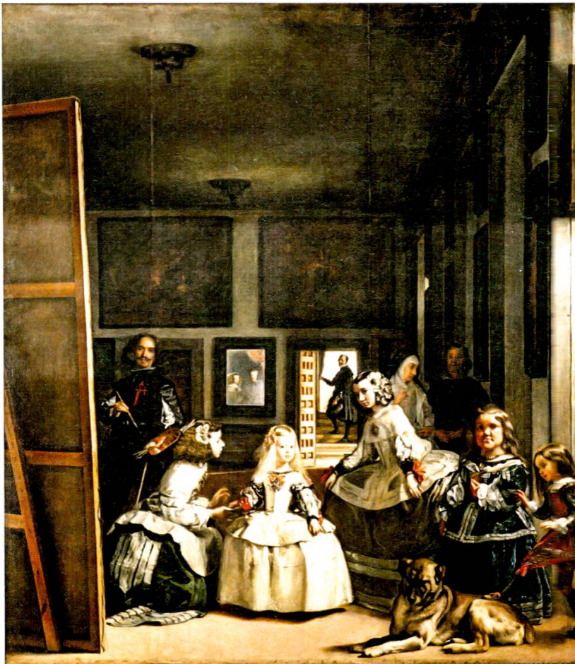
Abbildung 9: „Las Meninas“ („Die Hoffräulein“) von Diego Velázquez (gemalt 1656).

geschilderten Ereignissen auf der Bühne blieb; ähnliche Chorfiguren, die den Blick fangen und auf die zentrale Handlung hinweisen, wurden oft auch von den Malern verwendet ... Ein mittelalterlicher Autor empfiehlt sie sogar in seiner Schrift unter dem Titel Abhandlung über die Malerei : »Ich wünschte, es gäbe da eine Figur, die uns über das Geschehen des Bildes belehrt und unterrichtet ... « 85 Diese Art der Gruppierung ist m. E. ein weiterer Hinweis auf den europäisch geprägten Habitus des Fotografen.