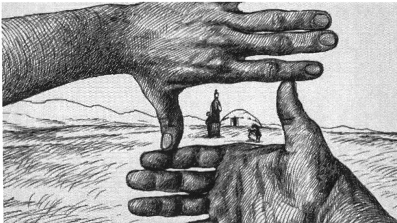
Abbildung 5: Manuelle Suche nach einem passenden Sujet.

Einem Gemälde gleich kommt die Ansichtskarte erst durch den Rahmen zustande, denn „die im Rahmen eingeschlossene Welt wird auf diese Weise zu einer sich selbst genügenden, autarken Welt ...“ 53 Zugänge zu dieser historischen Welt en miniature werden dann durch die praxeologische Analyse der historischen Ansichtskarte geschaffen.