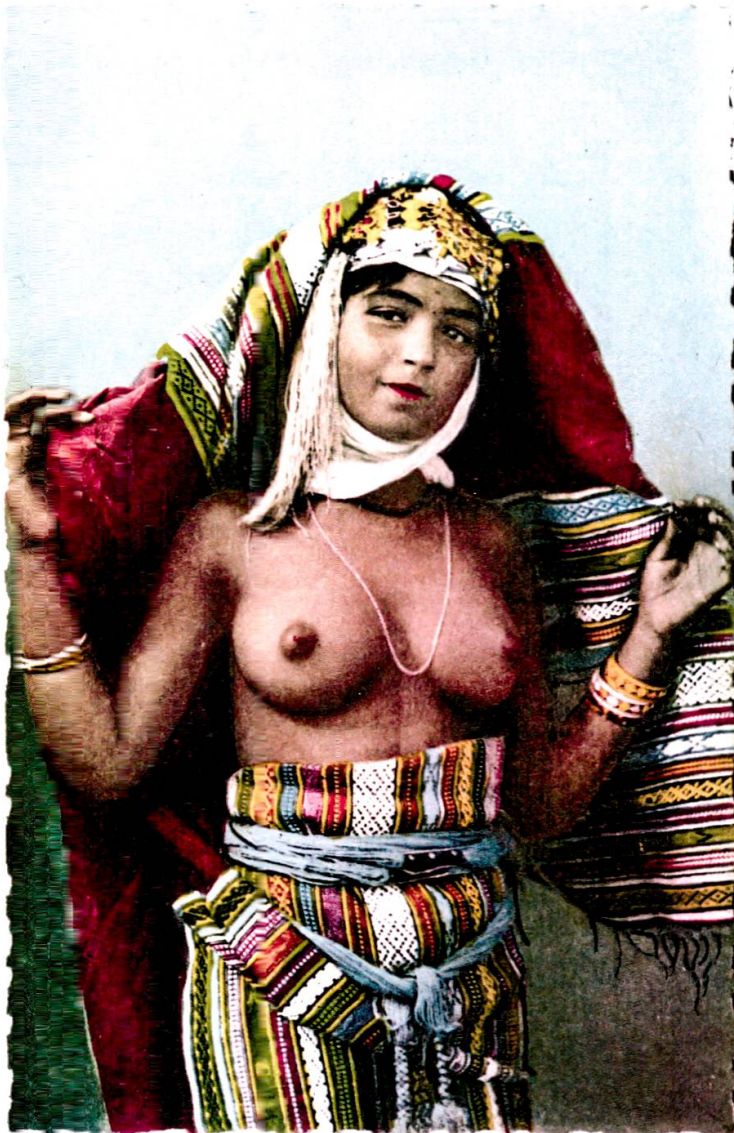
Abbildung 6: Französische Ansichtskarte «Beauté mauresque».

aber auch Kamele, das unvermeidliche Symbol des Orients, oder träge Esel als Zeichen der Rückständigkeit. Die gängigen Stereotypen beeinflussten die kommerziellen Orientaufnahmen.“ 66