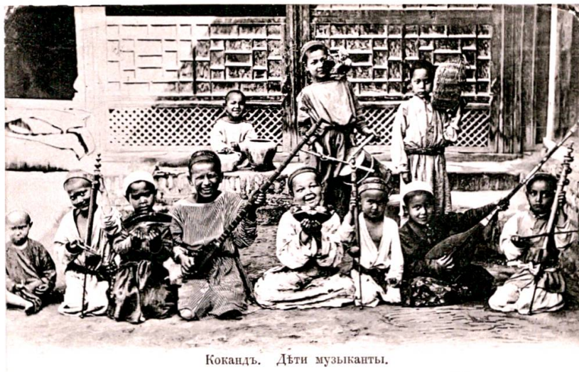
Abbildung 15: Russische Ansichtskarte «Kokand. Deti muzykanty», dt.: „Kokand. Kindermusikanten.“.