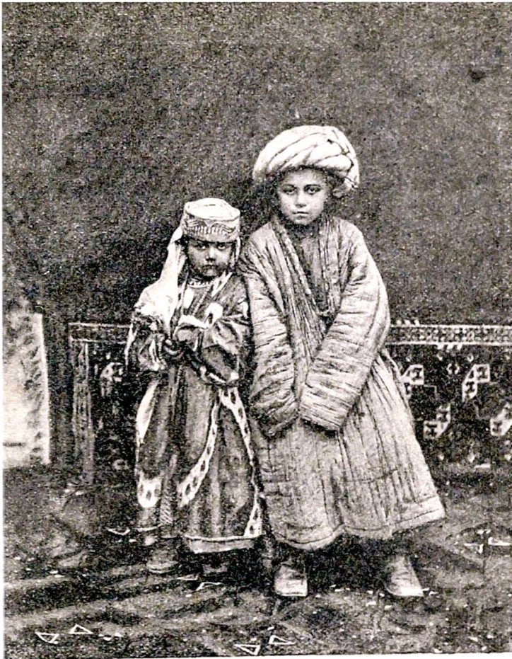
Рис. 197 Дети-бухарцы.

Abbildung 10: «Deti-bukharcy», dt.: „Kinder aus Buchara“.