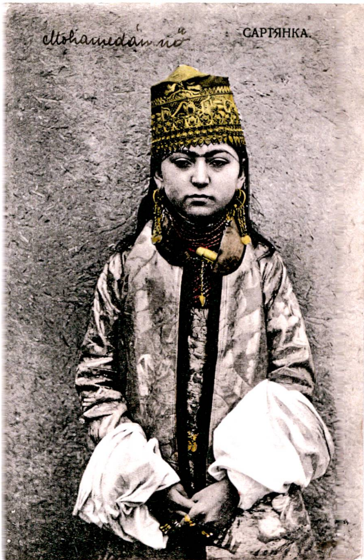
Abbildung 7: Russische Ansichtskarte «Sartjanka», dt: „Sartin“.

und Struktur wie auch den Habitus der Akteure und Institutionen des Feldes der russischen Orientfotografie.