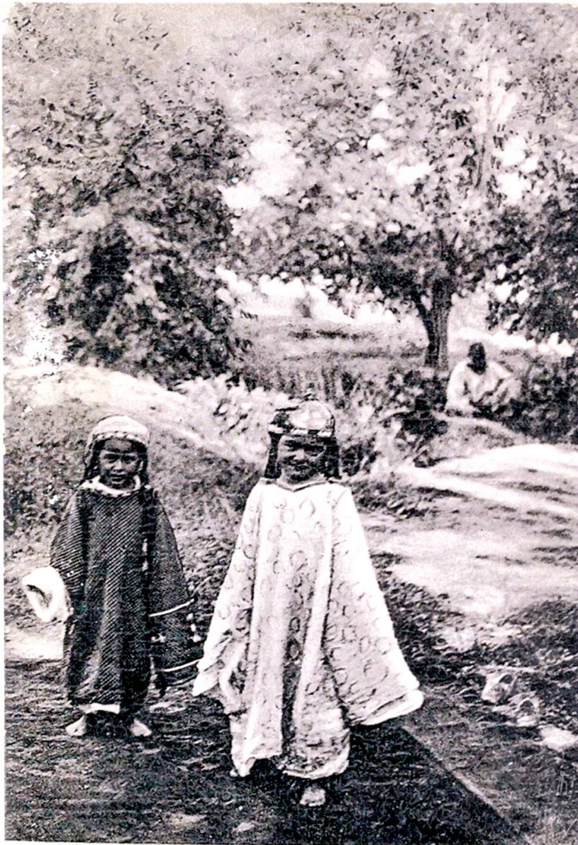
Типы сартовскихъ Дѣтей.

Diese Eigenschaft scheinen der Fotograf und sein Verlag erkannt zu haben, denn etwas später brachten sie einen Ausschnitt aus der ursprünglichen Fotografie der Kindergruppe als eine neue Schwarzweiss-Ansichtskarte mit demselben Titel („Typen von sartischen Kindern“) in Umlauf (siehe Abbildung 11). 88