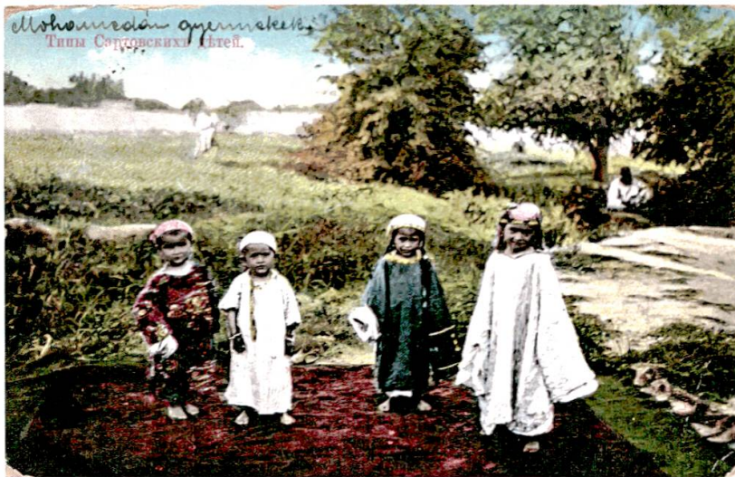
Abbildung 3: Russische Ansichtskarte « Типы Sartovskikh detej », dt.: „Typen von sartischen Kindern“.

Im Folgenden sollen die Grundlagen der besagten „seltsamen Übung“ Bourdieus kurz zusammengefasst und dann auf die russische Ansichtskarte („ Типы Sartovskikh detej “, dt.: „Typen von sartischen Kindern“, siehe Abbildung 3) 37 angewandt werden.