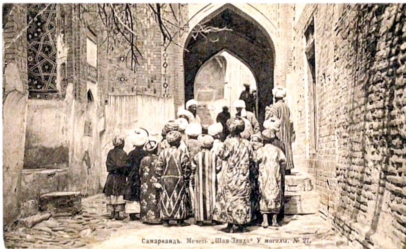
Abbildung 12: Russische Ansichtskarte «Samarkand. Mečet' „Šahi- Zinda“. U mogily. No 27», dt.: Samarkand. Moschee Schahi Sinda. Neben einem 10 Grab. Nr.7.

war, hineinwachsen , während es heutzutage seiner kindspezifischen Kleidung entwächst , selbst wenn diese – in ärmeren Familien – von seinen älteren Geschwistern oder gar von einem Elternteil stammt. Im letzteren Fall handelt es sich in meisten Fällen um eine umgeänderte und an die Morphologie des Kindes angepasste Kleidung. Wie sehr sich die Kindheit als soziale Praxis gewandelt hat, lässt sich am Streit in der Familie erkennen, zu dem es oft wegen der Übergabe der Kleidung von älteren an jüngere Geschwister kommt. Für die damaligen Verhältnisse jedoch trifft voll und ganz auch die folgende Anmerkung von Ariès zu, wie aus der Ansichtskarte „Samarkand. Mečet' „Šahi-Zinda“. U mogily. N o 27“ /dt.: Samarkand. Moschee Schahi-Sinda. Neben einem Grab. Nr.7“ 98 ersichtlich wird (siehe Abbildung 12): „... Hinsichtlich seines Aufzuges unterschied sich das Kind in nichts vom Erwachsenen. Eine gegensätzlichere Haltung in bezug auf die Kindheit lässt sich nicht denken.“ 99 Auf der Ansichtskarte ist ein Ausflug von Kindern dokumentiert, die wie Erwachsene en miniature gekleidet sind und dem heutigen Betrachter wie Zwerge vorkommen.