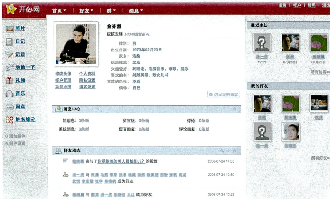
Illustration 1: Le Réseau Joyeux. Capture d'écran de ma page d'utilisateur. 24 juillet 2008 34 .