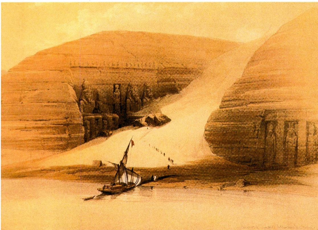
Abb. 3: Abu Simbel, Grabmal Ramses' II. Kolorierte Lithographie von David Roberts (aus: Piller, Gudrun et al. [2017]: Abb. S. 40).

Auf Anweisung der African Association wandte sich Burckhardt zweimal nach Süden, erforschte den Lauf des Nils bis nach Tinareh, der Grenze zum Reich Dongola, und beschrieb in seinen „Travels in Nubia“ ausführlich die beiden Uferstreifen mit der dort ansässigen Bevölkerung, den von ihr produzierten Nahrungsmitteln und auch die Ruinen ägyptischer Heiligtümer. Weltberühmt wurde der von ihm im März 1813 wiederentdeckte, obere und noch fast vollständig von Sand zugedeckte Totentempel Ramses' II. von Abu Simbel (Abb. 3); 19 der untere kleinere Tempel der Nefertari war zu seiner Zeit schon zugänglich. Seine zweite Reise nach Nubien schloss er mit einem ausführlichen Abstecher auf die arabische Halbinsel ab, wo er sich insbesondere über die Geschichte und die Glaubensregeln der Wahhabiten informierte: In Ta'if, einer Stadt östlich von Mekka, wo der ägyptische Vizekönig Muḥammad 'Alī Paša mit einer Gruppe religiöser Gelehrter Burckhardts umfassende Kenntnis des Koran und seine Glaubensfestigkeit im