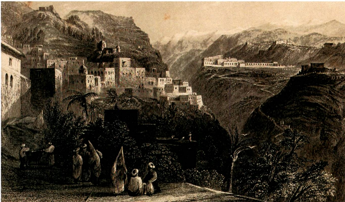
Abb. 4: Dair al-Qamar mit Blick nach Beit ed-Din. Stich (aus J. Carne: Syria, the Holy Land and Asia Minor . London/Paris [1842] Bd. I: Abb. links von S. 59).

und das Libanongebirge sofort steil ansteigt. 32 An dieser Stelle haben sich viele Herrscher durch Inschriften verewigt: von Ramses II. über Nebukadnezar bis zu Napoleon III., unter denen Burckhardt allerdings nur jene des römischen Kaisers Caracalla kopierte. 33 Die Landzunge von Beirut zu seiner Rechten liegend stieg er in Richtung des Chouf -Gebirges auf. Unter konstanter Zeitangabe, die er zu Fuss zwischen den einzelnen Dörfern benötigte, 34 beschrieb er Land und Leute – den Nahr Beirut, wo er erstmals einen Wald von Dattelpalmen sah, und die für die Seidenraupenzucht notwendigen Plantagen von Maulbeerbäumen; die Seidenproduktion war bis zur französischen Mandatszeit eine wichtige Einnahmequelle der lokalen Bevölkerung. Nach dem Gang über die wildromantische Brücke von Ġisr al-Qāḏī gelangte er in den Hauptort des Chouf , Dair al-Qamar 35 (Abb. 4). Drei Tage verbrachte er als Gast von Emir Bašīr Šihāb (Abb. 5) in dessen noch im Bau befindlichen Palast von Beit ed-Din 36 (Abb. 6). Burckhardt war ein geübter Fussgänger: Den Briefen aus Cambridge an die Eltern entnimmt man, dass er sich schon in England intensiv und zwar barfuss auf