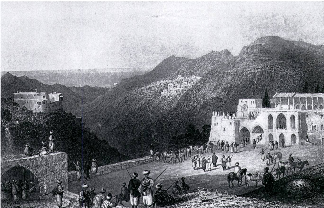
Abb. 6: Beit ed-Din mit Blick nach Dair al-Qamar. Stich (aus J. Carne: Syria, the Holy Land and Asia Minor. London/Paris [1842], Bd. I: Abb. links von S. 26).