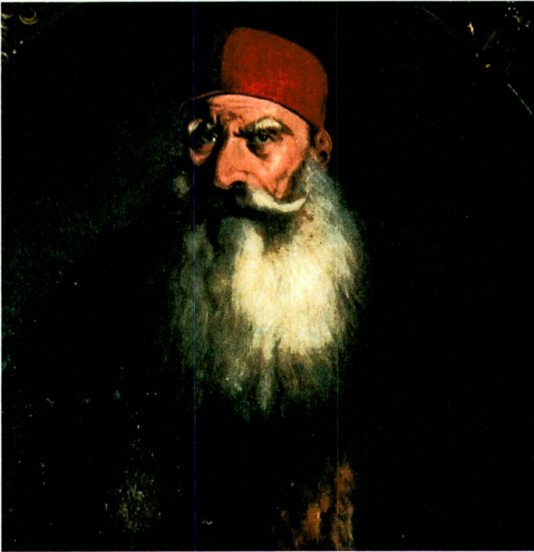
Abb. 5: Emir Bašir Šihāb. Ölgemälde. Palast von Beit ed-Din (aus: Jidejian [1995]: 225).