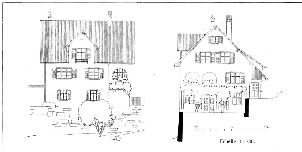
En haut: Maison de campagne près de Berne. — En bas: Façades de la maison de M. Hösli-Kubli à Ennetbühl près Glaris. Architecte: Fr. Glor-Knobel, Glaris.

chargé la société suisse des entrepreneurs de l'organisation du 4 e Congrès international du bâtiment.