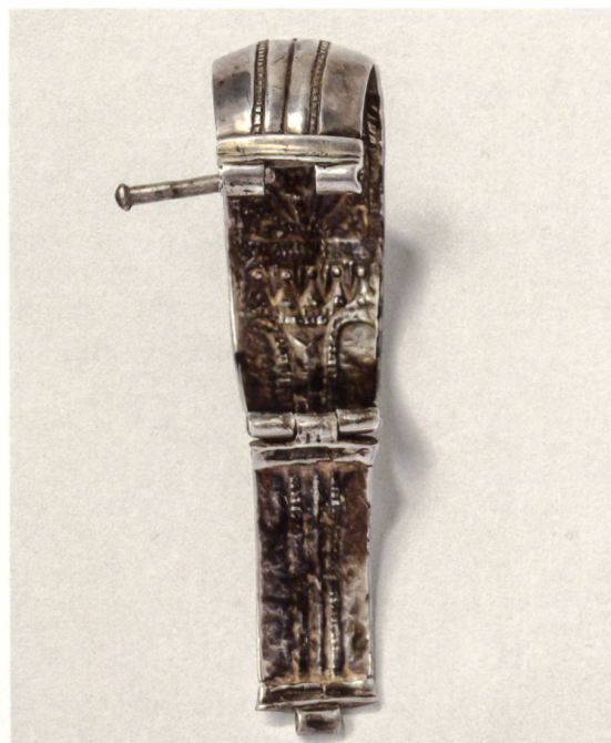
← Fig. 5 Charnières de la paire de gauche Fig. 4, à tubes segmentés (charnerons) avec goupille, dont l'une sert de fermoir.

Ces remarquables paires de bracelets trouvent des parallèles exacts dans deux découvertes faites sur territoire vaudois, l'une à Baulmes, sur la crête de Forel, et l'autre à Bex, au lieu-dit Sous-Vent. À ce jour, la recherche d'attestations de produits similaires sur le reste du territoire romain n'a donné aucun résultat. Il semble qu'on soit donc face à une production locale très caractérisée et unique Encadré 1. Ils relèvent très vraisemblablement de la parure féminine. La comparaison avec quelques bracelets masculins à charnière attribués à la catégorie des décorations militaires doit être exclue de notre point de vue, après examen approfondi des témoins montrant une conception et une ornementation différentes du bijou.