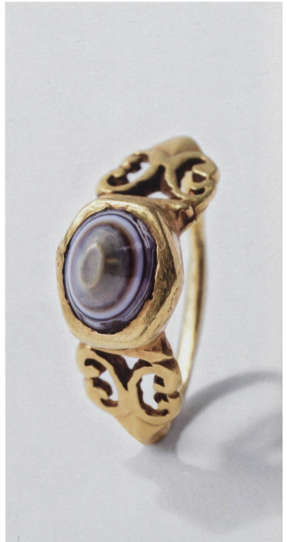
→ Fig. 3 Bague en or à chaton d'agate et épaules ciselées. L'anneau est aplati (larg. int. 21,5 mm, haut. int. 16 mm). L'élargissement aux épaules est matérialisé par un motif triangulaire à nervure centrale de type fer de lance, puis orné de deux arceaux à volutes ajourés, légèrement divergents, réservant un vide triangulaire sous la barrette d'attache au chaton. L'agate rubanée, ovale (long. 12 mm), est orientée dans l'axe de la bague.

Ce type de bague, aux épaules ajourées et au chaton placé au-dessus de la ligne de l'anneau, est caractéristique de la production romaine de la fin du 2 e siècle et du 3 e siècle. Le type s'avère particulièrement diffusé en Gaule Belgique et dans les provinces germaniques, ainsi que dans les régions de Lyon et du Genevois. Il correspond, pour les spécialistes, au type 3f de la typologie établie par Hélène Guiraud : il s'agit de bijoux de prix, en majorité réalisés en or ou en argent. Cette auteure relève d'ailleurs que la plupart de ses occurrences proviennent de trésors cachés dans la seconde moitié du 3 e siècle, signalant la préciosité conférée à ce genre de bague. L'ornementation de notre exemplaire trouve des comparaisons étroites : on retiendra ici celle, quasiment identique, d'une bague en or du marché antiquaire (Fabiandemontjoye.com), dont les arceaux et le fer de lance forment un seul ornement rappelant une pelte et la barrette sommitale est légèrement recourbée; ou au décor approchant d'une bague en argent acquise en 2014 par le Musée de Saint-Germain-en-Laye et appartenant au trésor dispersé de Nizy-le-Comte, découvert en 1975; dans le même ordre d'idée, citons encore une bague en argent d'Avenches conservée à Genève, dont les épaules sont plus simples et moins ajourées, reprenant toutefois la paire d'arceaux adossés, et dont les attaches au chaton, ovale, sont sans barrette.