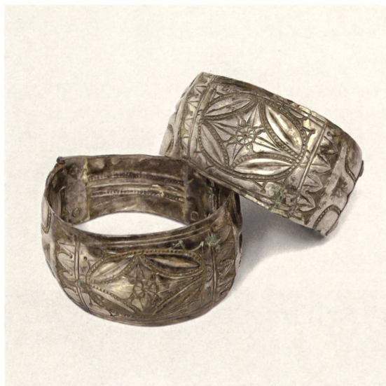
← Fig. 4 Paires de bracelets à charnières ornés au repoussé, de factures différentes. Noter les légères variantes du décor et, à gauche, les têtes bien visibles des goupilles aux charnières.