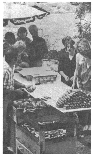
Mittagsverpflegung: Wurst u. Brot

Der Sporttag ist für viele Schüler ein Jubeltag, aber leider auch für viele ein Greuel. Deshalb sollte dieser Tag nur von freiwilligen Schülern besucht werden müssen. Denn unbewegliche Schüler blamieren sich ja nur vor den guten Turnern, haben Angst und werden verspottet. Ich frage mich, was dieses zur Schau stellen seiner eigenen Unfähigkeit mit moderner Erziehung zu tun hat! G.S.