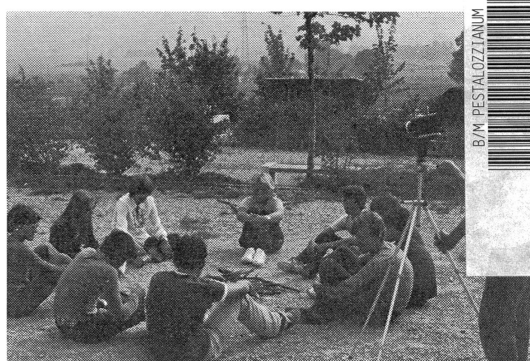
Projektwoche erste Klasse: Einführung in die Filmkunde. Nach eigener Drehbuchvorlage wird ein kleiner Spielfilm gedreht.