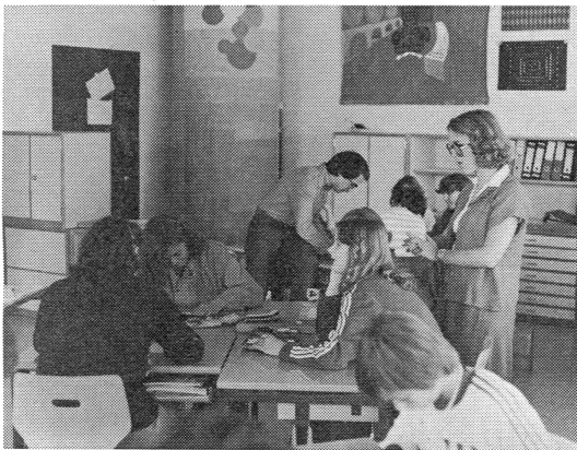
Team-teaching an einer zweiten Klasse. Stammklassenlehrer und Handarbeitslehrerin unterrichten gemeinsam.

Der Ausdruck Team-teaching bedeutet soviel wie: Im Team lehren, also zu zweit eine Klasse führen. Im Gegensatz zur Gruppenarbeit der Schüler, die gewissermassen im Team lernen, bedeutet Team-teaching der Unterricht zweier Lehrer zur selben Zeit in einem bestimmten Fach. Im Schulhaus Petermoos wird diese Unterrichtsform in den miteinander gekoppelten Fächern «Zeichnen und Gestalten» und «Werken und Gestalten mit Textilien» (beide aus dem musisch-technischen Bereich) praktiziert. Das heisst, dass in der Regel der Stammklassenlehrer zusammen mit einer Handarbeitslehrerin den Unterricht bestreitet. Wie es im Petermoos zu dieser neuen Form des Lehrens kam, soll in der Folge in kurzen Zügen dargestellt werden.