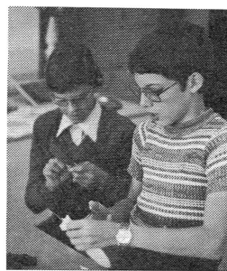
Zwei Erstklässler im Fach «Werken und Gestalten mit Textilien», gekoppelt mit dem Fach «Zeichnen».

lich auf, dass Stammklassenlehrer (in den meisten Fällen der Zeichnungslehrer) und Handarbeitslehrerin vermehrt zusammenarbeiteten und sich in diesem musischen Bereich auch methodisch und inhaltlich abstimmen. Dabei gab es verschiedene Möglichkeiten, die Form dieses Team-teachings anzuwenden.