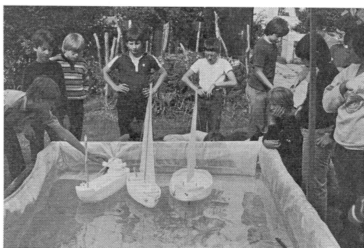
Bau verschiedener Schiffstypen nach selbstgefertigten Plänen. Dank der Hilfe des Abwarts konnten die Schiffe in einem Planschbecken auf ihre «Seetüchtigkeit» geprüft werden.