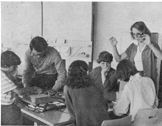
Gemeinsame Einführung in die Perspektive. Später wird sich die Klasse teilen und das neu Erlernete an verschiedenen Materialien erproben.