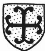
Herren von Hallwil